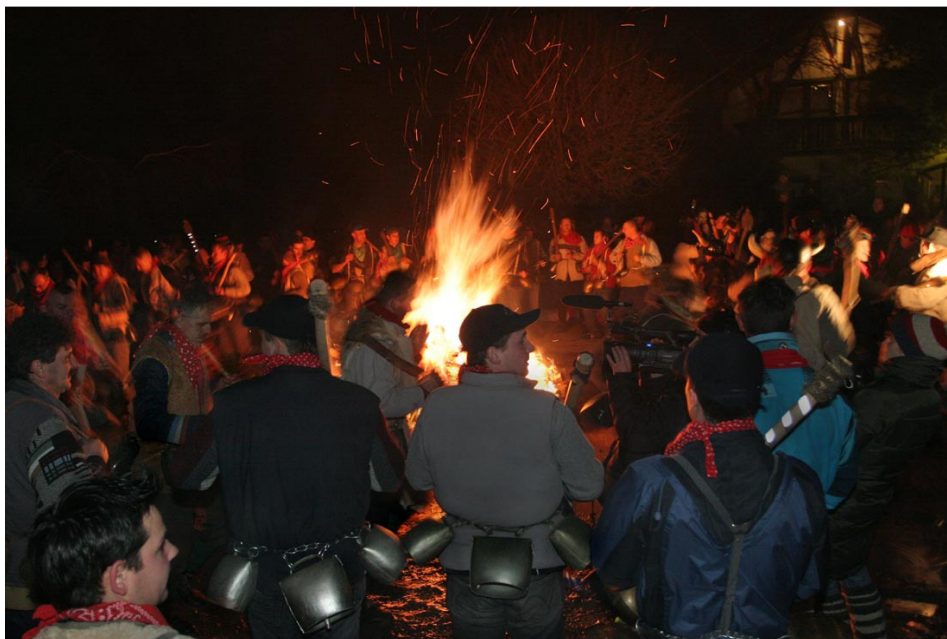
Slika 18: Kurentov skok, 2008 (osebna zbirka Dušana Ježa).