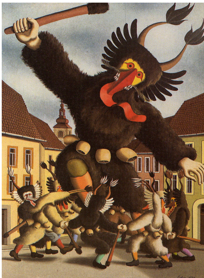
Ples demonov, 1979, olje na platnu (Gačnik 1995: 16).