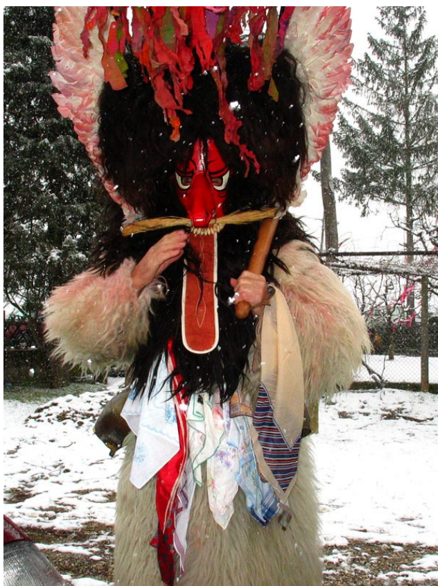
Pernati kurent, 2008 (osebna zbirka Dušana Ježa).