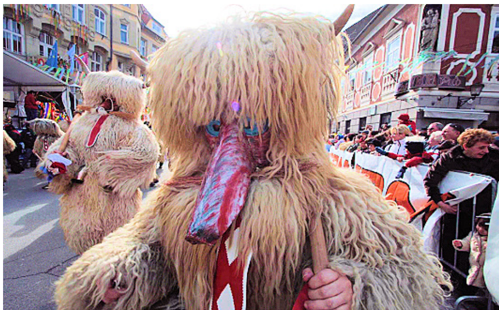
Slika 6: Nos rogatega kurenta, 2008.