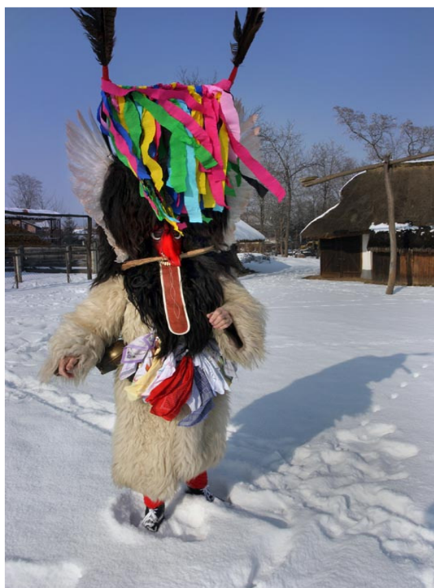
Slika 3: Pernati kurent v vasi, 2008.