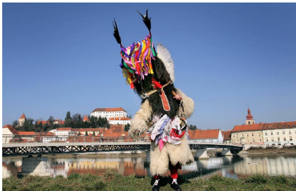
Slika 2: Pernati kurent v svoji opravi, 2008 osebna zbirka Dušana Ježa).