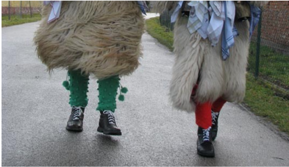
Slika 9: Kurentove gamaše, 2008 (osebna zbirka Dušana Ježa).