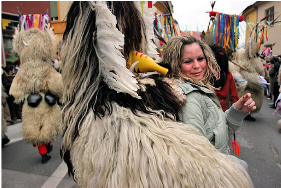
»Kurentov ples« z dekletom, 2008.