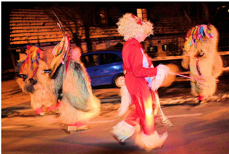
Slika 17: Hudič s kurenti, 2007.

Naloga hudiča je, da naznani skupino kurentov oz. njen prihod na dvorišče podeželske hiše, sam pa uganja razne norčije. Kurentom priskoči na pomoč pri odpiranju vrat, saj so sami zelo neokretni. Dejansko deluje kot varnostnik skupine kurentov.