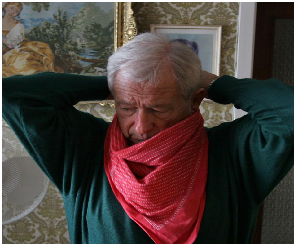
Kurentova ruta, 2008 (osebna zbirka Dušana Ježa).