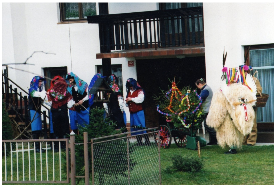
Slika 14: Markovski orači na kmečkem dvorišču, 1999.