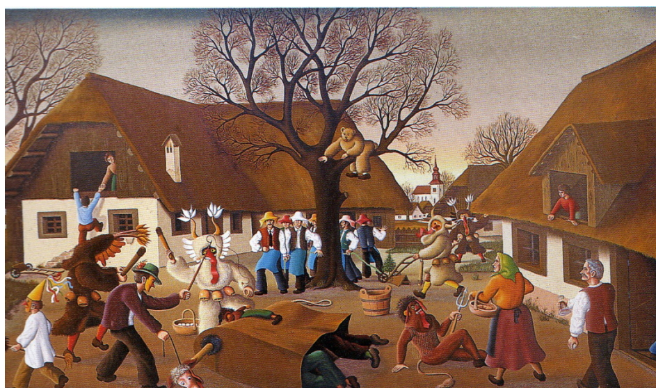
Na kmečkem dvorišču, 1982, olje na platnu (Gačnik 1995: 20).