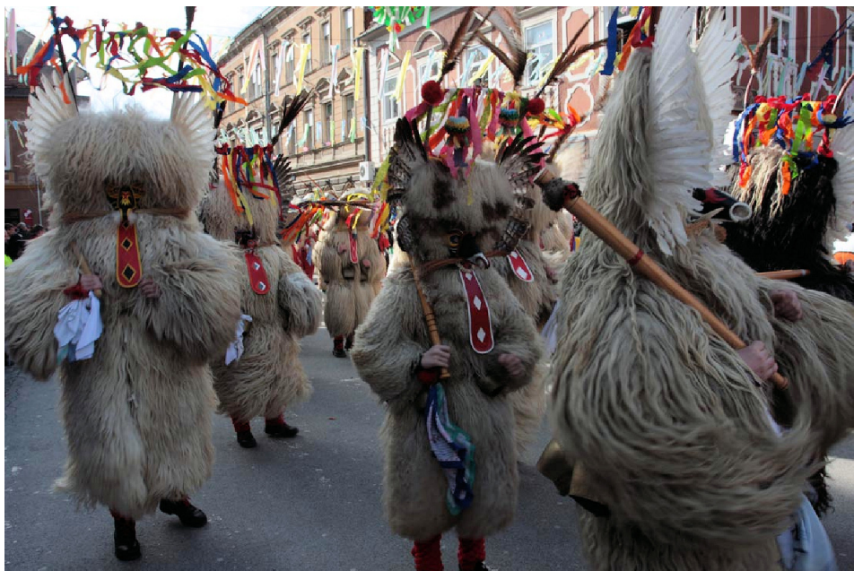
Skupina pernatih kurentov na karnevalu, 2008.