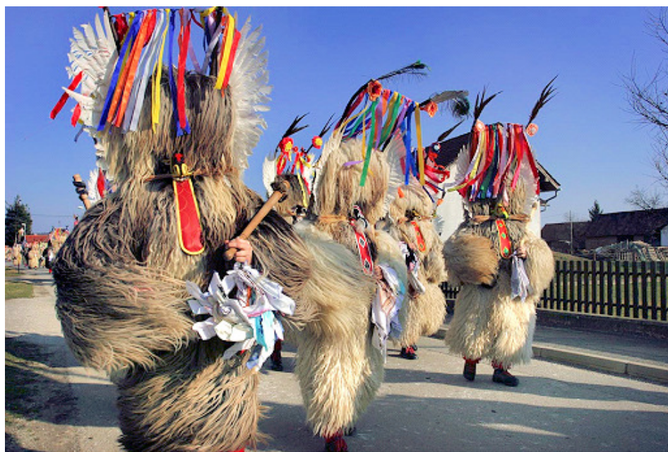
Slika 16: Skupina pernatih kurentov med »plesom«, 2008.

Za skupine pernatih kurentov je značilno, da jih spremlja hudič ali 'tajfl' po domače. Hudič je oblečen v rdeč jopič in rdeče hlače, obut je črne čevlje. Na glavi ima kapo, ki je podobna kurentovi. Naličje kape je pobarvano z živo barvo ter ima odprtine za oči in usta. V ustih ima zobe iz belega fižola in na vsaki strani