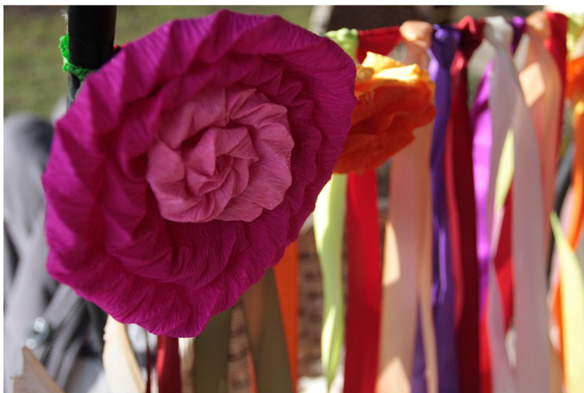
Slika 7: Rože in trakovi pernatega kurenta, 2009.

približno petdeset ali več centimetrov. Na vrhu vsakega rogu je pritrjeno eno ali tri peresa. Med obema rogovoma je napeta žica, na katero so privezani pisani trakovi in rože iz raznobarnega krep papirja oz. iz blaga.