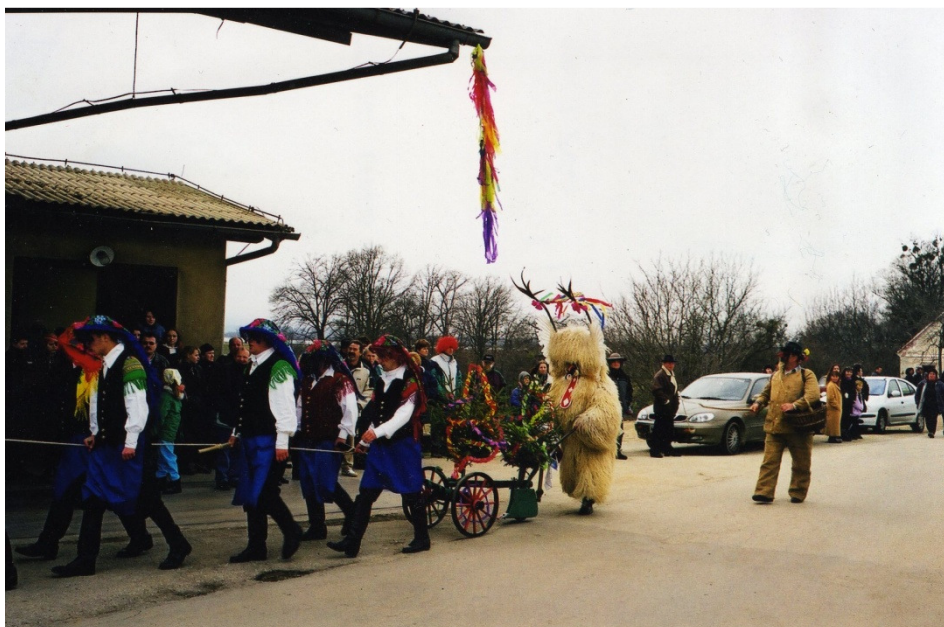
Slika 13: Orači iz Markovcev, 1998 (osebna zbirka Franca Letonje).

Prav tako tudi orači iz Markovcev prično orati v soboto dopoldan in orjejo vse do pustnega torika dopoldan. Orači za oranje prejmejo darove od gospodinje, to so hrana, pijača, krofi. 38