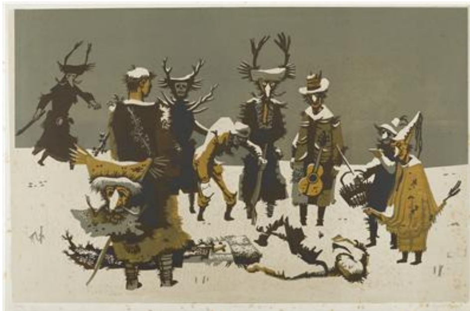
Slika 21: France Mihelič: Mrtvi Kurent, 1955, grafika (Komelj 2002: 53).

v spomin. Na osnovi te izkušnje je nastalo veliko slik in znana, če že ne kulturna, grafika z naslovom Mrtvi kurent (Komelj 2002: 53–54).