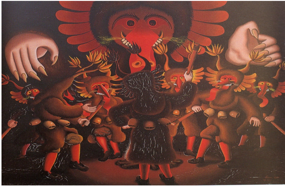
Ob ognju, 1981, olje na platnu (Gačnik 1995: 26).