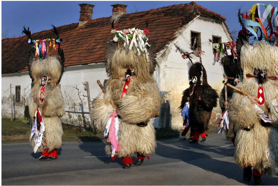
Obhod pernatih kurentov po vasi, 2008.