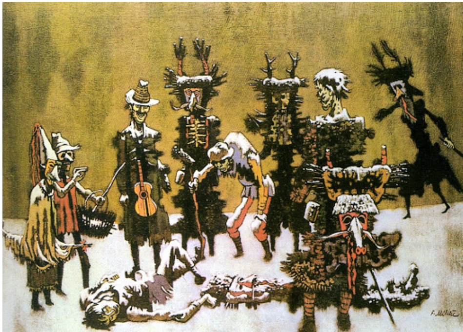
Mrtvi kurent, 1973, akril (Komelj 2002: 65).