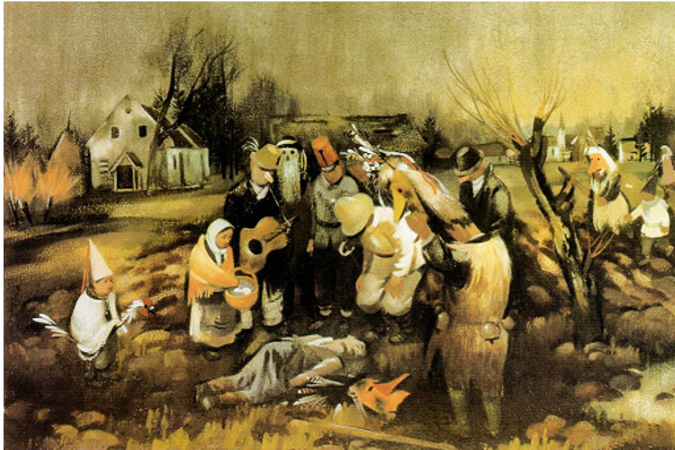
Mrtvi kurent, 1938, olje (Komelj 2002: 56).