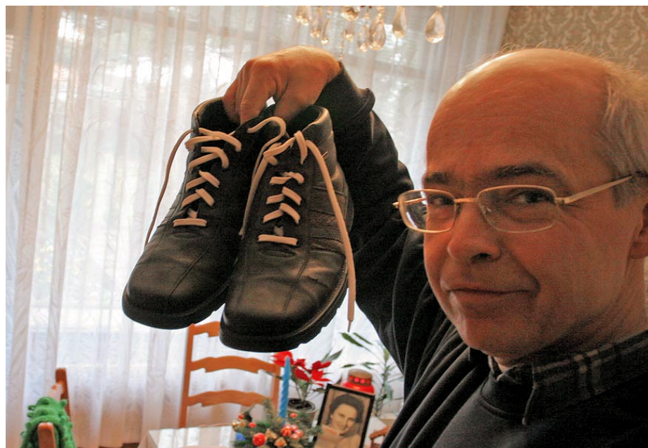
Slika 10: Kurentova obuvala, 2008 (osebna zbirka Dušana Ježa).