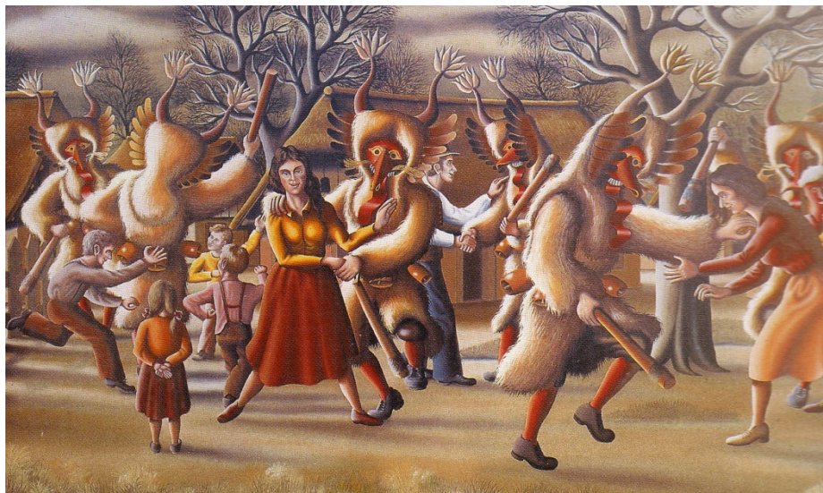
Vaški praznik, 1986 (Gačnik 1995: 12).