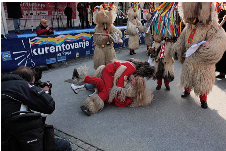
Norčije hudiča, 2008.