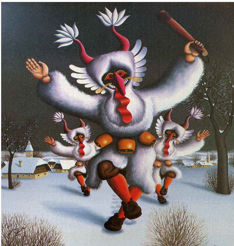
Slika 22: Boris Žohar: Zim, 1985, olje na juti (Gačnik 1995: 20).