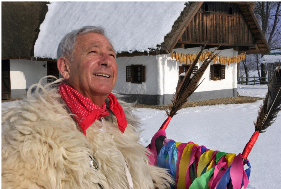
Kurent pri domačiji, 2008 (Dušan Jež).