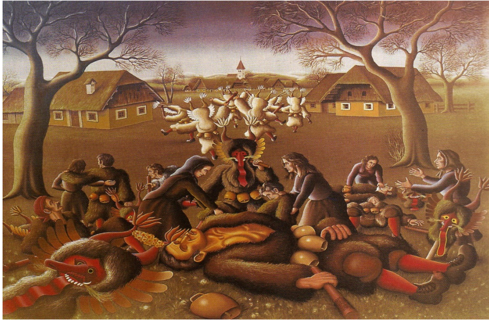
Drama za vasjo, 1984, olje na platnu (Gačnik 1995: 40).