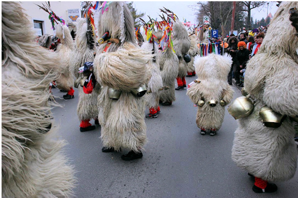
Kurenti, 2009.