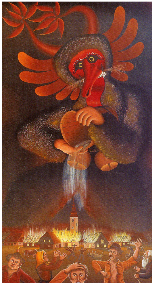
Goreča vas, 1981, olje na platnu (Gačnik 1995: 30).