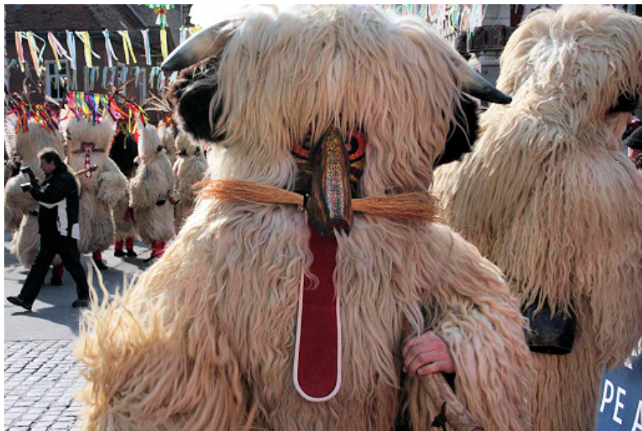
Naličje rogatega kurenta, 2008 (osebna zbirka Dušana Ježa).