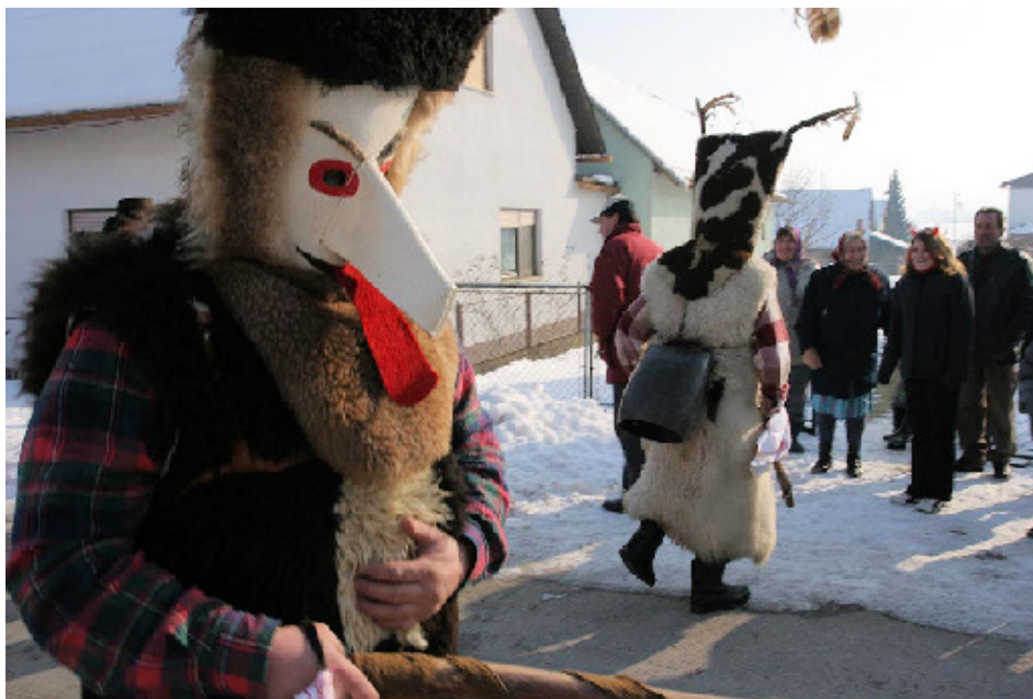
Slika 1: Rekonstrukcija prvotnega kurenta, 2008.

Prvič sta kurenta širši slovenski javnosti predstavila France Marolt, oče slovenskega folklorizma, in Fran Žižek leta 1939 na Festivalu narodnih običajev v Mariboru. Pred tem dogodkom je malokdo vedel zanj (Kornelj 2002: 130).