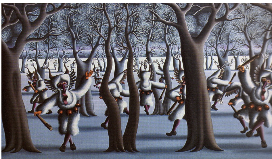
Zima III, 1986, olje na platnu (Gačnik 1995: 15).