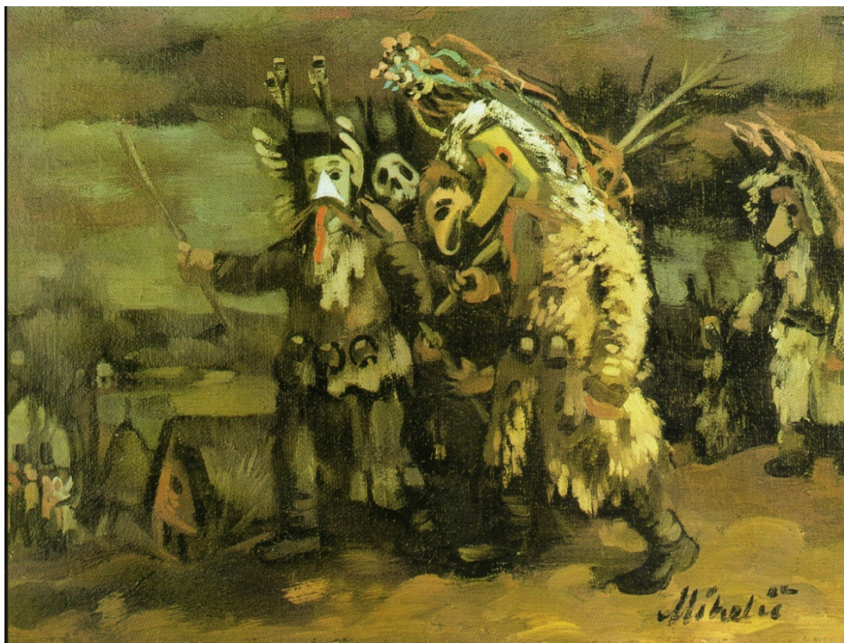
Pohod kurentov II, 1942, olje (Komelj 2002: 51).