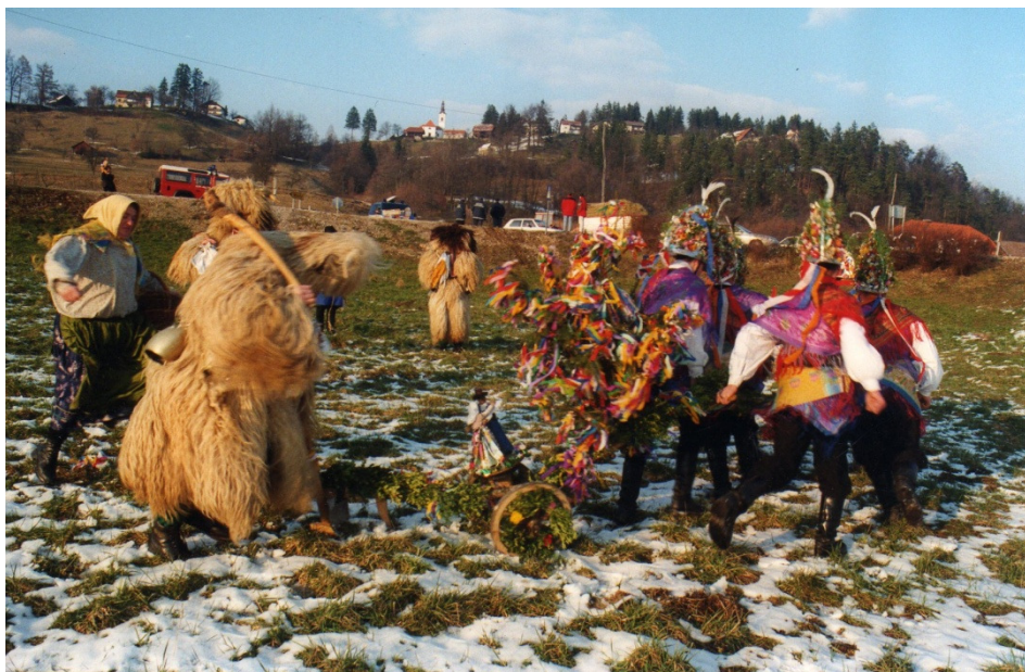
Slika 12: Oranje lancovskih oračev, 1999.

V Lancovi vasi ta obred izvajajo vsako leto v pustnem času od pustne sobote (popoldan) pa vse do opoldneva pustnega torka.