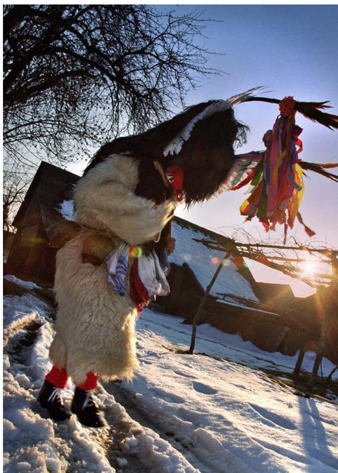
Pernati kurent na kmečkem dvorišču, 2008 (osebna birka Dušana Ježa).