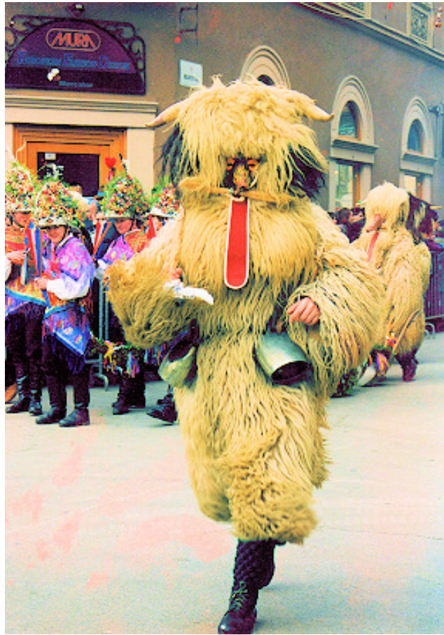
Lancovski kurent, 1993 (osebna zbirka Franca Drobnična).