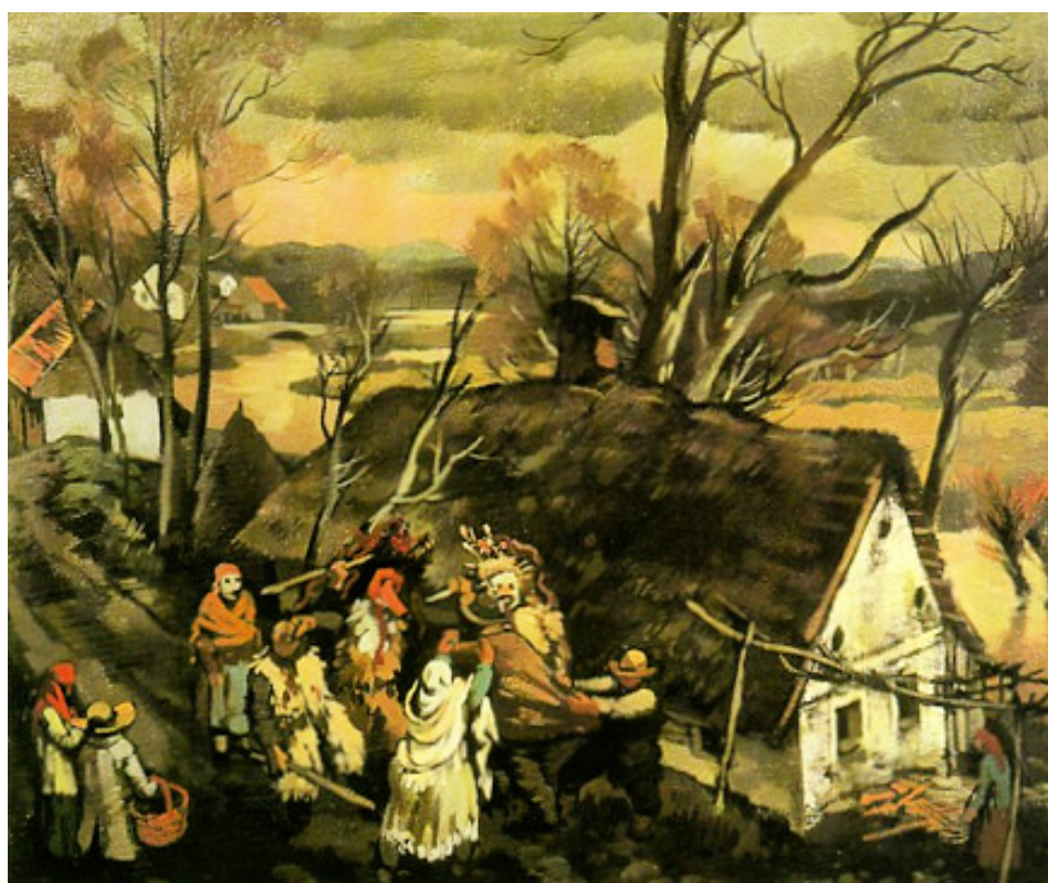
Pretep kurentov, 1942, olje (Komelj 2002: 76).