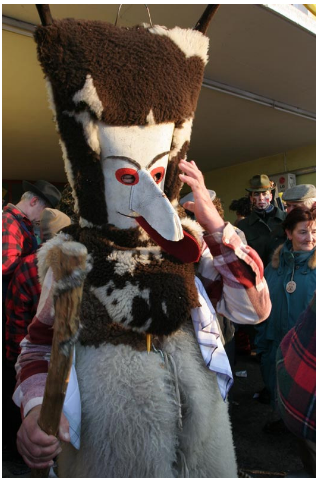
Podoba kurenta iz preteklosti, 2008.