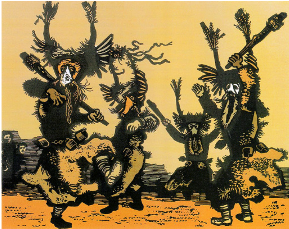
Ples Kurentov, 1953, barvni linorez (Komelj 2002: 136).