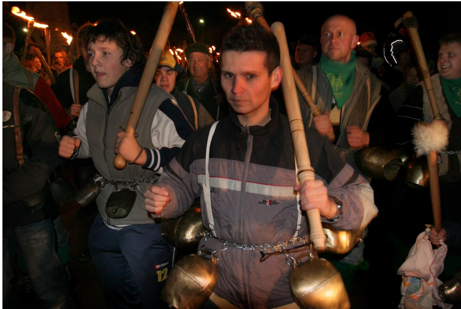
Slika 20: »Kurenti« z zvonci in ježevko na skoku, 2008.

Zgodovina kurentovanja na Ptuju je povezana z Dragom Haslom. 18.2.1959 je predal idejo o » etnografskem karnevalu « (Gačnik 2004: 339). Zgodovinskemu društvu Ptuj. Haslova ideja in njegov etnološko muzeološki program sta se realizirala naslednje leto, in sicer natančneje 27.2.1960, kar pomeni, da se je na dan zgodilo prvo kurentovanje na Ptuju (Gačnik 2004: 338–341).