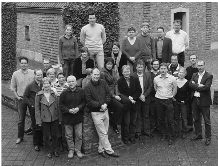
Het ROA in 2008