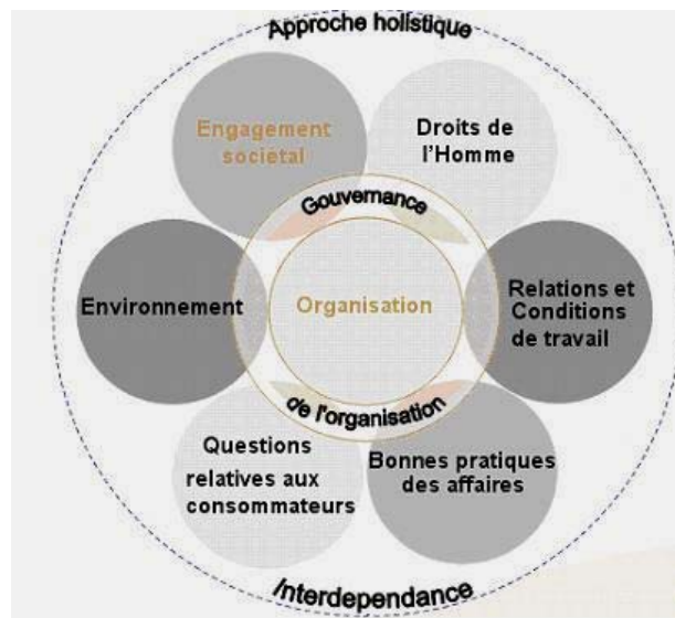
Figure 1 : Les sept questions centrales de ISO 26000

Les sept questions centrales sont déclinées au total en 36 domaines d'action (annexe 1), eux-mêmes couvrant plusieurs sphères d'activités. Par exemple, le domaine d'application « développement des ressources humaines et formation professionnelle » de la question centrale « relations et conditions de travail » couvre des sujets tels la discrimination, l'équilibre travail-famille, la promotion, le développement des compétences, la promotion de la santé et du bien-être, la formation, l'équité, la mise en place de programmes sociaux etc.