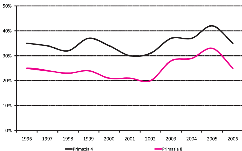
Gráfico 3: Indicador de Primazia da Indústria de Defensivos Agrícolas (1996-2006)

(2008), foram comparados os anos de 2005 e 2002. A Bayer CropScience e a Syngenta, respectivamente, com 18,8% e 15,4% de participação de mercado, alternaram de posição no período (Syngenta com 17,2% e Bayer CropScience com 14%), enquanto Basf e Monsanto mantiveram suas posições de terceira e quarta maiores empresas no mercado brasileiro. As subsidiárias de multinacionais que dominam o mercado brasileiro têm vantagens competitivas associadas ao comércio intrafirma, pois têm oferta garantida de matéria-prima e produtos intermediários e acesso direto a um fluxo contínuo de inovações por parte das matrizes.