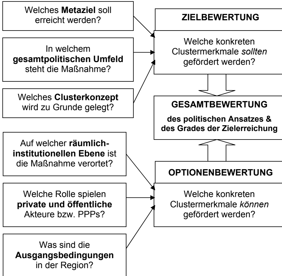
Abbildung 2: Bewertung der Passfähigkeit von Clustermaßnahmen im innovationspolitischen Kontext