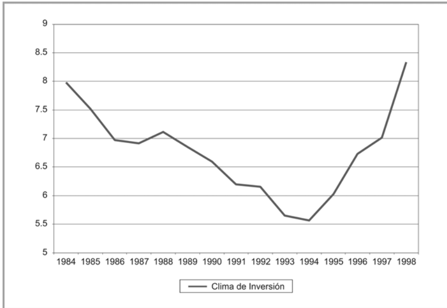
Gráfica 2. Promedio mundial del índice de clima de inversión del Grupo PRS 13 .

para dos períodos cortos, mientras que las variables de riesgo país lo están para todos los años y para todos los países de la muestra.