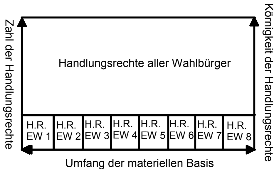
Abb. 3: Individualeigentum bei Teilzentralisierung aller grobkörnigeren Rechte, eigene Darstellung

In Abbildung 3 wird nunmehr unterstellt, dass zwar nach wie vor individuelles Eigentum an den Wohnungen auf der untersten Ebene der Internalisierungshierarchie gegeben ist, doch alle Infrastrukturentscheidungen ohne Berücksichtigung der Internalisierungsrelevanz ausschließlich durch die Vertreter (politische Agenten), einer größeren und mit Blick auf Wohneigentum offenen Gruppe getroffen werden.