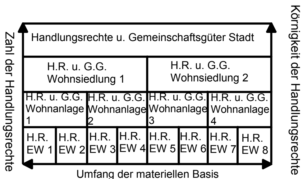
Abb. 2: Individualeigentum bei vollständiger dezentralisierender Internalisierung, eigene Darstellung

Zur Verdeutlichung dieser Zusammenhänge sei eine Internalisierungshierarchie für einen Wohnblock mit individuell gehaltenen Eigentumswohnungen skizziert. Für die nachfolgende Abbildung wird vollständig dezentralisierende Internalisierung unterstellt. Die (individuellen) Eigentümer von Eigentumswohnungen stimmen - der Internalisierungsrelevanz folgend - zuerst in der geschlossenen Gruppe der Eigentümerversammlung über die Gemeinschaftsanlagen bezüglich des Wohnblocks ab. Auf der nächsten Ebene der Internalisierungshierarchie kann man sich alle Eigentümer von Wohnungen in einer gleichfalls geschlossenen entsprechend größeren Gruppe organisiert vorstellen, die über die z. B. infrastrukturellen Belange einer ganzen Wohnsiedlung aus Wohnblocks mit Eigentumswohnungen befindet. Schließlich kann man sich auf der letzten in Abbildung 2 erfassten Ebene vorstellen, dass über die Infrastruktur einer ganzen Stadt, die aus Wohnsiedlungen der eben beschriebenen Art besteht, durch eine entsprechende Versammlung (oder ihre Vertreter) entschieden wird.