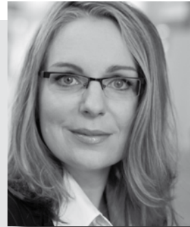
Prof. Dr. Claudia Kemfert Leiterin der Abteilung Energie, Verkehr, Umwelt am DIW Berlin

Frau Prof. Kemfert, ein deutsches Firmenkonsortium plant den Bau eines riesigen Solar-Kraftwerks mit dem Namen DESERTEC in Nordafrika, das über Fernleitungen Europa mit Strom versorgt. Ist ein solches Projekt Science-Fiction oder tatsächlich machbar?