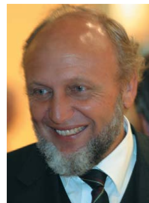
Prof. Dr. Dr. h.c. Hans-Werner Sinn Präsident des ifo Instituts

Hätten auf den Arbeitsmärkten wettbewerbliche Verhältnisse für die Lohnfindung bestanden, so wären die Löhne langsamer gestiegen, und der Strukturwandel wäre langsamer vonstatten gegangen. Ein größerer Teil der arbeitsintensiven Binnensektoren hätte gehalten werden können, und deshalb hätte trotz einer vergleichsweise geringeren Beschäftigung im Export insgesamt eine höhere Beschäftigung realisiert werden können. Und obwohl sich die Wertschöpfung im Export langsamer entwickelt hätte, wäre die Wertschöpfung aller Sektoren zusammen genommen schneller gestiegen. Deutschland hätte effizient auf die Kräfte der Globalisierung reagiert und die Vorteile aus der internationalen Arbeitsteilung, denen es seinen Aufstieg nach dem Krieg verdankt, weiter ausbauen können. Dass unser Land diesen Weg nicht ge-