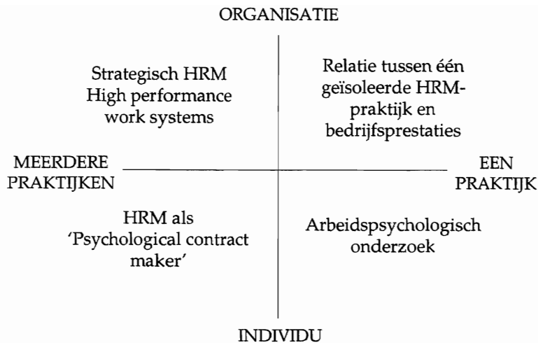
Figuur 1. Typologie van 'HRM-performance'-onderzoek.

Het 'één praktijk'-onderzoek op individueel niveau kent ongetwijfeld de langste traditie. Deze onderzoekslijn heeft haar roots vooral in de arbeids- en organisatiepsychologie. De centrale vraag is hier hoe een individuele techniek (b.v. prestatiebeloning, assessment center, 360°-feedback, etc.) de individuele prestaties, arbeidstevredenheid of betrokkenheid kan bevorderen. Denk aan onderzoek naar de predictieve validiteit van gestructureerde interviews of biografische vragenlijsten. Veel van dit onderzoek steunt op experimentele designs waarbij een bepaalde HRM praktijk bijvoorbeeld wél toegepast wordt op een experimentele en niet op een vergelijkbare controlegroep en vervolgens het verschil in vaardigheid, attitude of prestaties gemeten wordt.