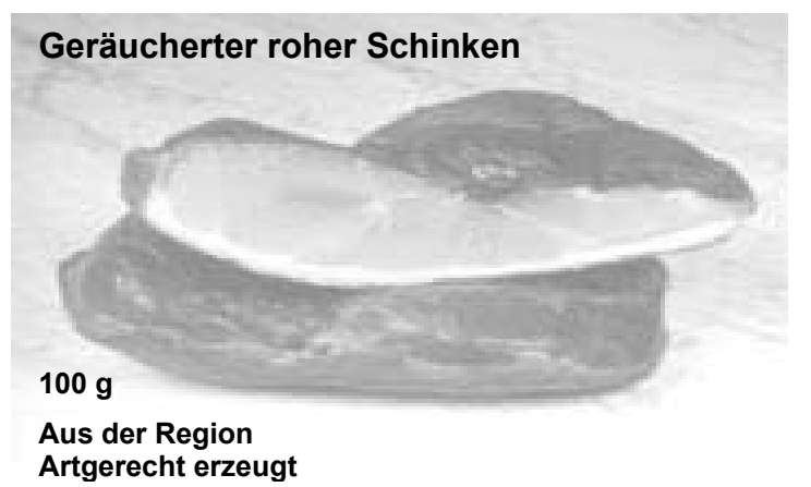
Grafik 1. Beispiel eines multiattributiven Produktstimulus des conjointanalytischen Erhebungsdesigns

Um der Anforderung nach Kaufrelevanz der Eigenschaften bzw. ihrer Ausprägungen Rechnung zu tragen, wurde die Präferenzmessung ausschließlich bei solchen Probanden durchgeführt, für die die zu testenden Attribute von Relevanz sind (gefiltertes Sample, n = 789 ). 6 WEIBER und ROSENDAHL (1997: 111) weisen in diesem Zusammenhang darauf hin, dass eine grundsätzliche Relevanz der zu testenden Eigenschaften eine zentrale Voraussetzung für die Durchführung einer Conjoint-Analyse ist. Sind die zu tes-