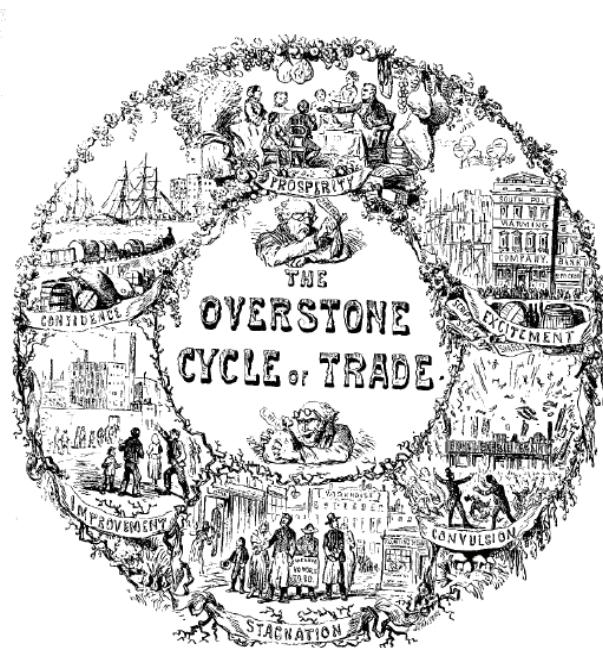
Trade Cycle cartoon, from a print

tipologia delle crisi, che prende le mosse da quella della banca Overend, Guerney & co. nel 1866, preceduta in Inghilterra da almeno due altre serie crisi finanziarie: nel 1825 (quando la stessa Banca d'Inghilterra rischiò il fallimento) e nel 1847 (quando si sgonfiò il boom degli investimenti ferroviari). E' una vignetta che ricostruisce il "ciclo economico" così come visto da un non meglio identificato signor Overstone.