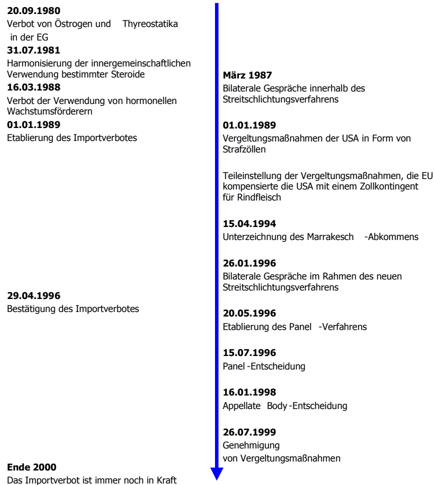
Schaubild 2: Der zeitliche Ablauf des Hormonstreites