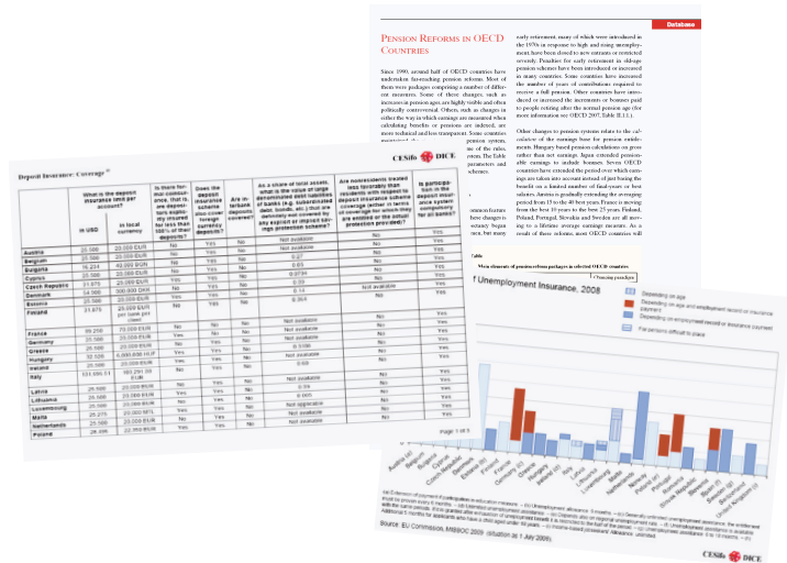
Abb. 2 Beispiele für Tabellen, Graphiken und Berichte ...