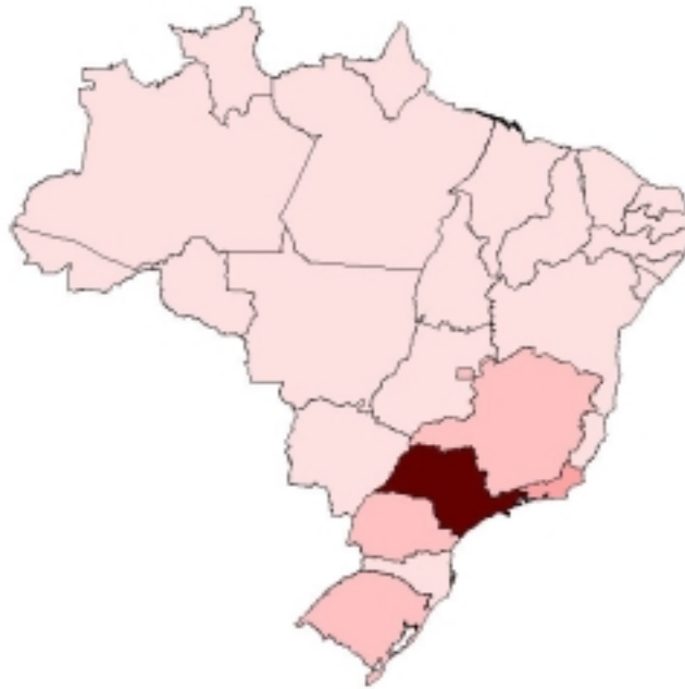
Mapa 5.1 Intermediação Financeira por UF (2001)