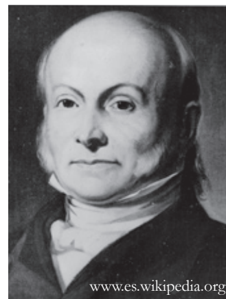
John Quincy Adams