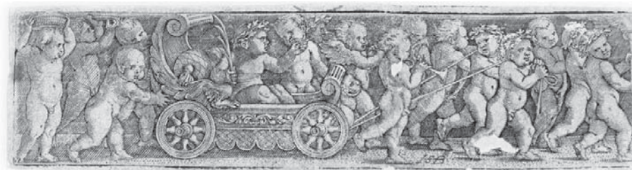
Fig. 1. HANS SEBALD BEHAM. El carro del triunfo . (Circa 1531) Grabado calcográfico. Biblioteca Nacional

dad entre el público, en especial durante la representación de los entremeses, suponía un elemento sobresaliente de una festividad ya de por sí la más famosa entre las celebradas durante el calendario litúrgico en la ciudad de Sevilla.