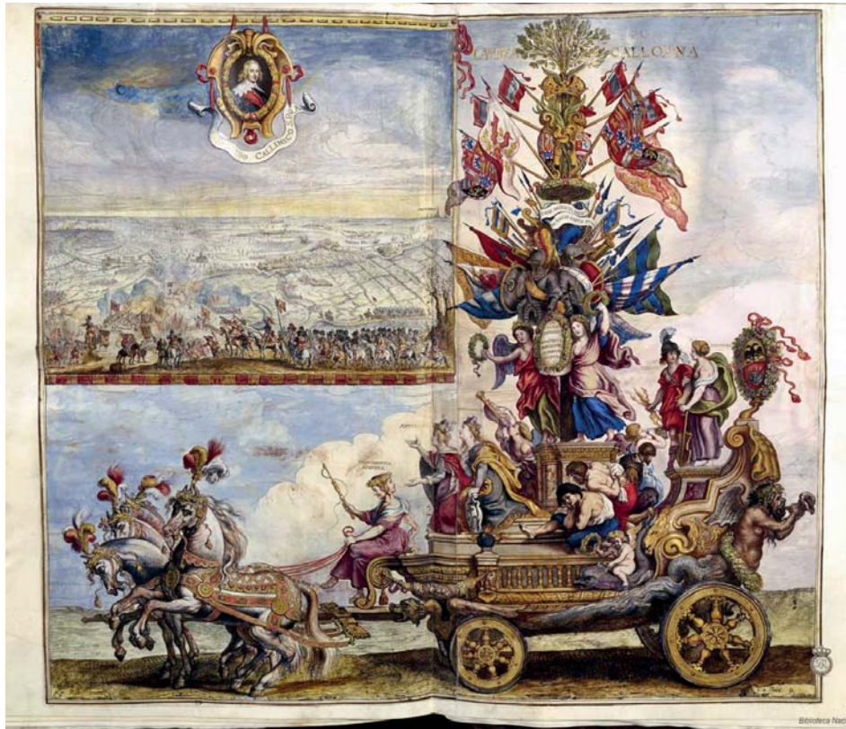
Fig. 3. PETER PAUL RUBENS y THEODORO A. THULDEN. Laurea Calloana . Carro triunfal en honor del príncipe Fernando (1642). Ilustración al aguafuerte de Pompa Introitus ...

lo hacen exaltando la tan sevillana creencia inmaculadista en la alegría por el breve pontificado en 1617 34 o por la beatificación de Ignacio de Loyola en 1610. 35 En general se trata de un conjunto de materias relacionadas con la formación colegial de los principales centros docentes sevillanos, patrocinadores a su vez de importantes mascaradas; la capacidad para la conformación de espectáculos y textos dramáticos que estos colegios, especialmente de los jesuitas de San Hermenegildo, mantuvieron a través del teatro infantil y humanístico orientado a las enseñanzas de la Retórica o el Latín, serviría como experiencia para el uso de la metáfora clásica que abunda en la máscara. 36