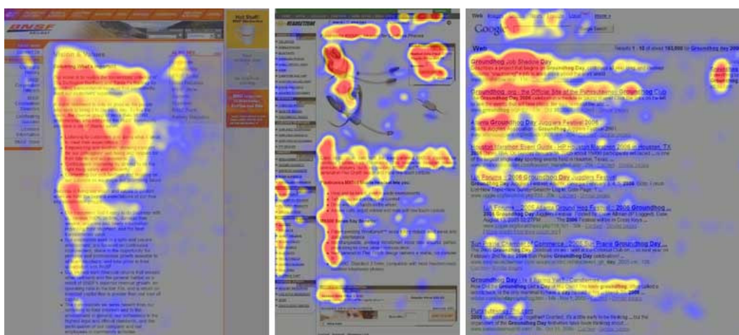
Figura 2 - F-Shaped Pattern