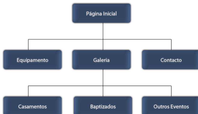
Figura 4: Árvore de navegabilidade (mapa do site)

Neste caso trata-se de um sítio Web de uma empresa de reportagens fotográficas. Na figura 4 podemos ver que a nossa Página Inicial tem três hiperligações para outras páginas: Equipamento, Galeria e Contacto. A página Galeria tem subsecções que permite escolher: Casamentos, Baptizados e Outros Eventos.