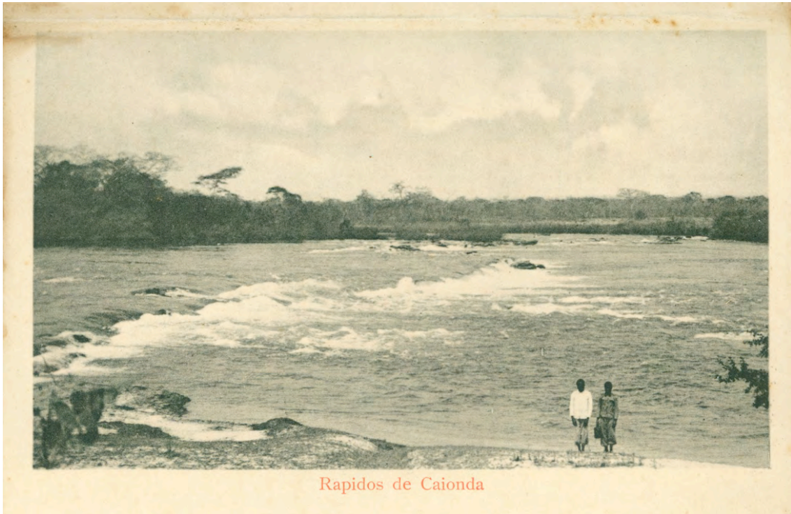
Rapidos de Caienda

Aliás, a narrativa publicada, tanto em imagens como em texto aponta para estes vectores, quando olhamos para as fotografias inéditas parece-nos que as preocupações do autor terão ido para além desta promoção do colonialismo, inscrevendo-se, todavia e como é comum nesta época, numa sede de conhecimento do outro , baseada em pressupostos positivistas que apontam para a intervenção do europeu no mundo desorganizado e de trevas em que o africano vive. Só essa intervenção poderia trazer até ao conhecimento e ao usufruto da tecnologia uma parte da população mundial que vivia em estado quase primitivo . Contudo, não deixa de ser um testemunho muito importante sobre os saberes e quotidianos das populações retratadas e de ter um valor documental assinalável. É, igualmente, assinalável o facto de as fotografias se encontrarem em excelentes condições de preservação, podendo ser perfeitamente trabalhadas no presente, a par de outras fontes documentais.