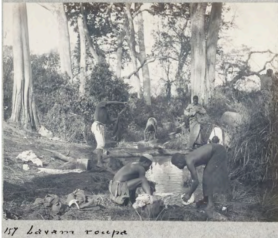
157 Lavam roupa

ou à saúde e às curas tradicionais, em que se destaca o tratamento das doenças por sangrias demoradas também são reportadas.