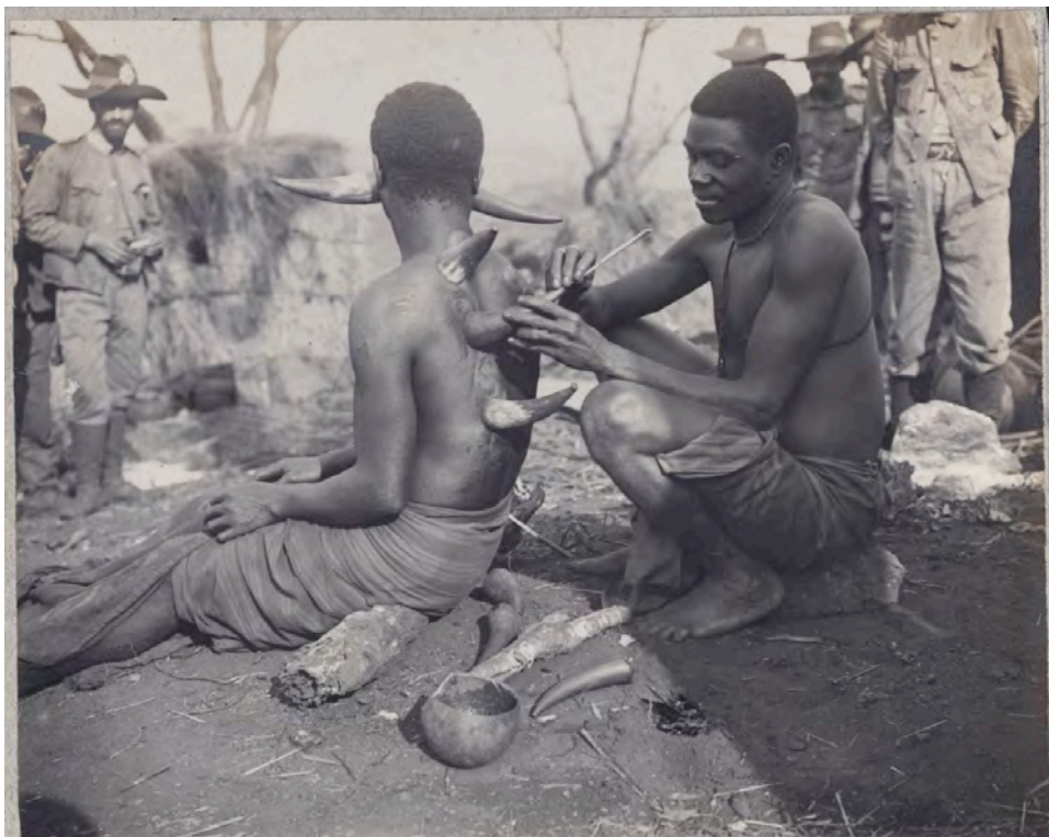
144 Extração das ventosas originaes

ou à saúde e às curas tradicionais, em que se destaca o tratamento das doenças por sangrias demoradas também são reportadas.