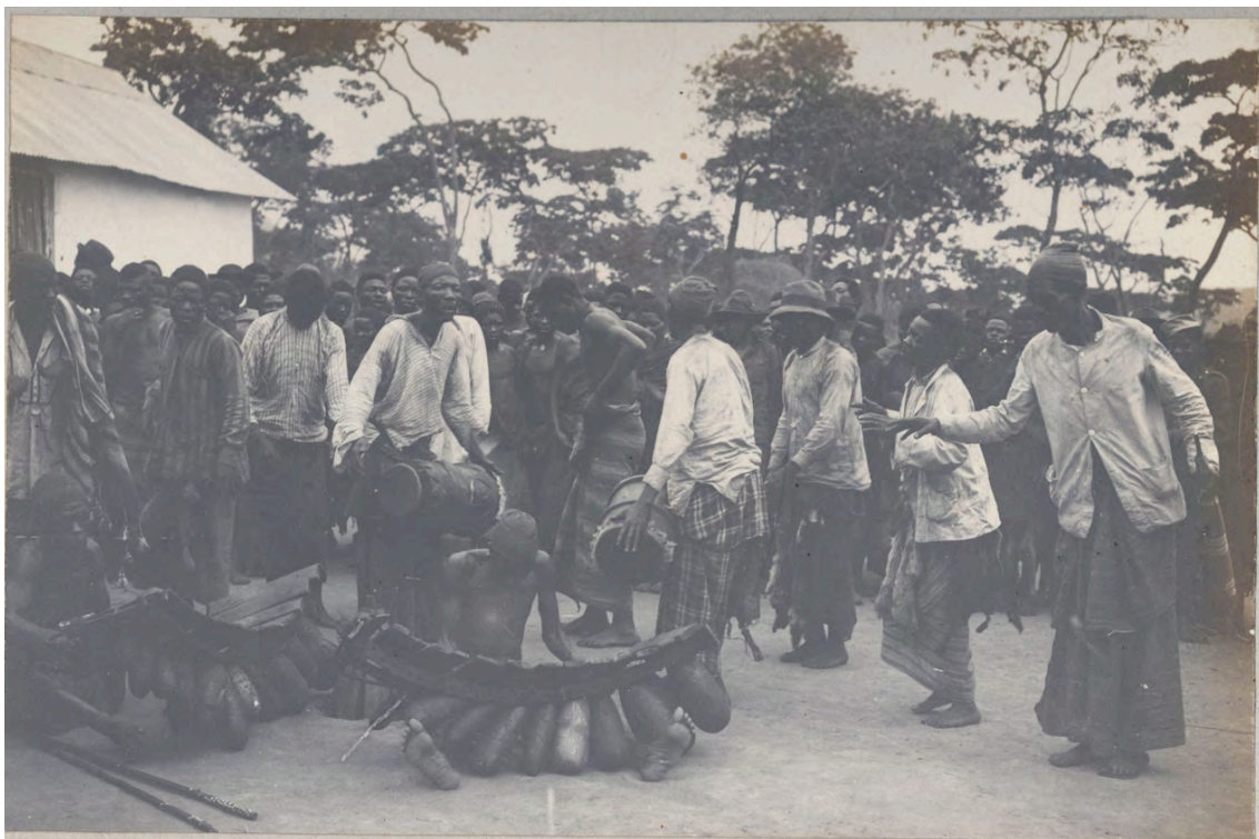
52 Dança de homens