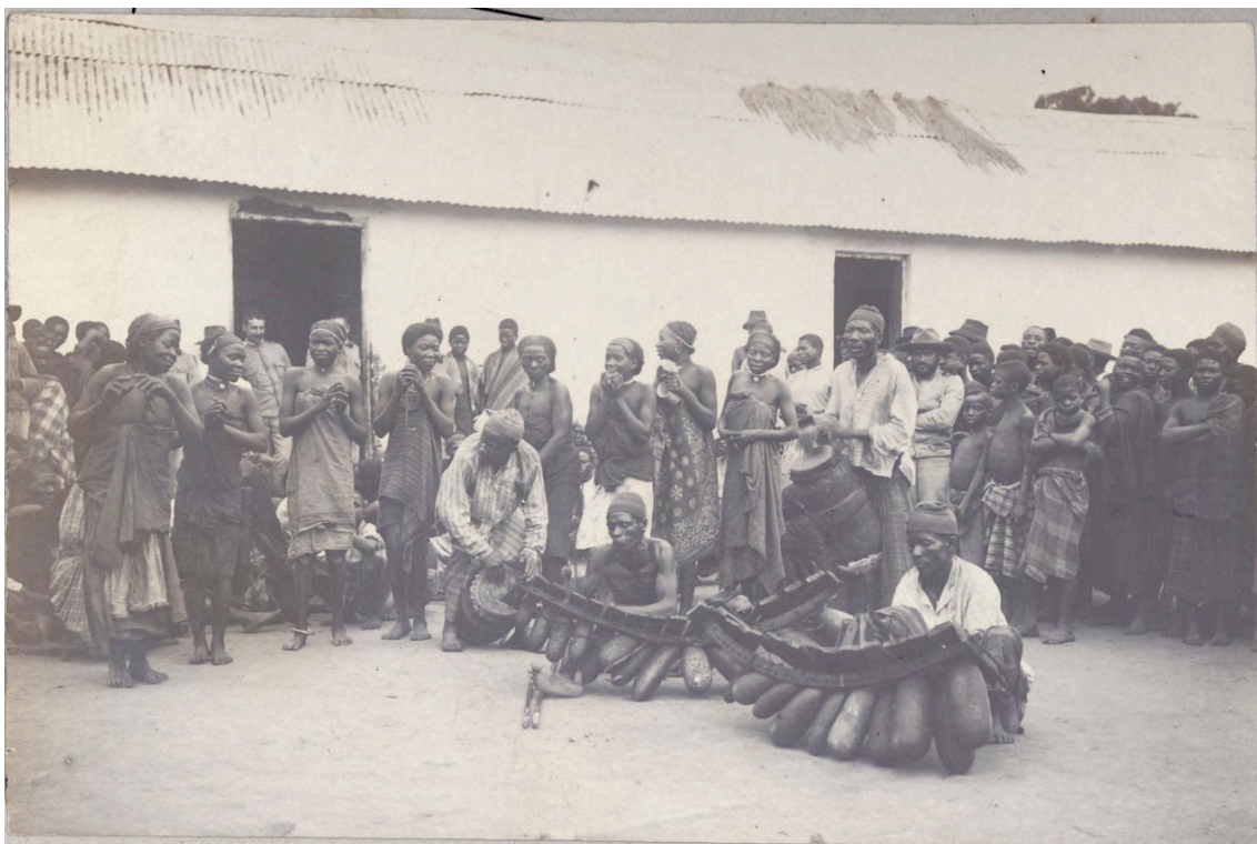
51 Dança de mulheres

referência aos mestres de dança e à orquestra, bem como, à especificidade das danças feitas em honra dos brancos.