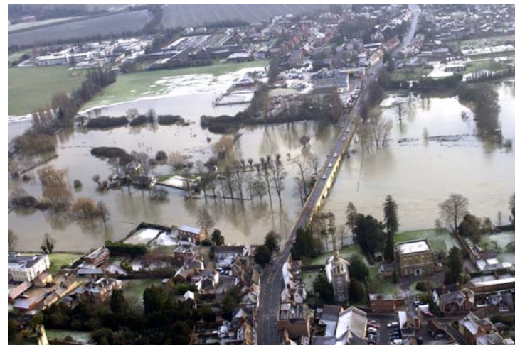
Evento de inundación del Támesis en Wallingford – Enero 2003

La mayor parte de los 448 cuerpos de agua del río, 46 cuerpos de lagos, 10 cuerpos de agua de transición y costeros, y de los 45 cuerpos de agua subterránea en el Támesis, están en riesgo de no alcanzar el “buen estado”, debido principalmente a las fuentes de contaminación difusa. Esto tiene una relación directa con las actividades de uso del suelo.