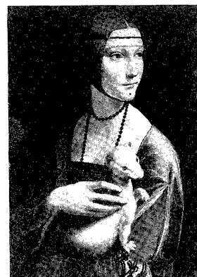
図8 「チェチリア・ガルレラーニ」