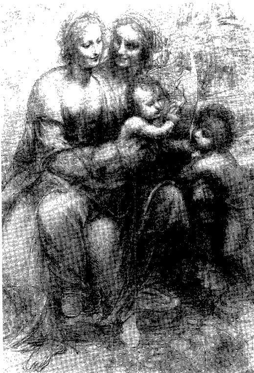
図5 「バーリントン・ハウスのカルトン」

「カルトン」にも不確定な上方を指さす指先がみられるが、これは「聖ヨハネ」の指先と明らかに異なる。つまり、「カルトン」の聖アンナの指先の身振りは、どちらかと言えば副次的・付随的で