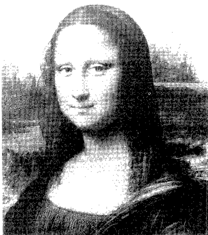
図7 「モナ・リザ」部分

「モナ・リザ」と「聖ヨハネ」は、一見、何の共通点もないように見える。「モナ・リザ」は一私人の肖像画であるが、「聖ヨハネ」は宗教画である。「モナ・リザ」は女性像であるが、「聖ヨハネ」は男性像である。という風に、一見すると両作品には類似点すらないように見える。