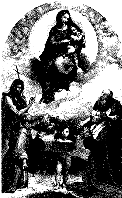
図3 ラファエルロ作「フォリニョの聖母」

<指さす>聖ヨハネ像は、ルネサンス時代にさまざまな画家によって描かれた。レオナルドの聖ヨハネと同様の上方を指さすポーズは、例えば、ラファエルロの「フォリニョの聖母」(図3) (1511-12年)に見られる。従って、クラークが考えるほどには、この指さす身振りそのものの中には、