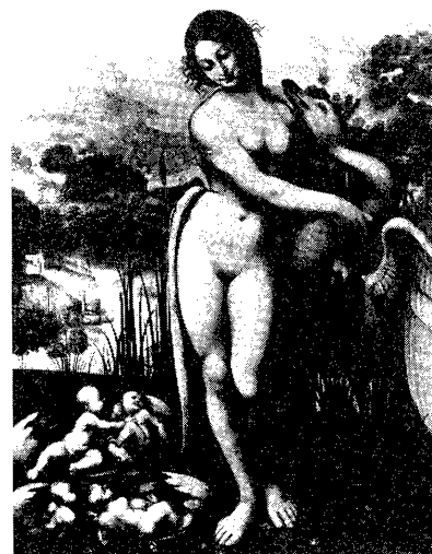
図6 レオナルド作「レダ」の摸作