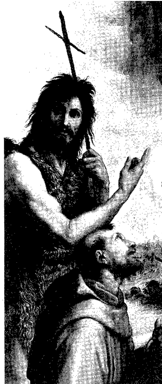
図4 「フォリニョの聖母」部分

人を当惑させるものはないと思われる。我々を<不安にさせる>ような要素は別のところにある。これを明らかにするために、まず、レオナルドの「聖ヨハネ」をラファエルロの「フォリニョの聖母」と比較してみよう。