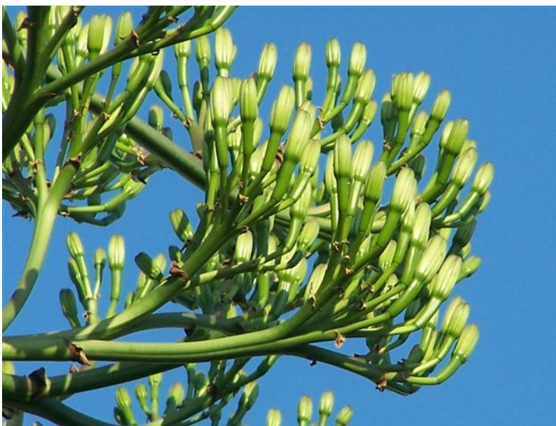
Foto 3. Agave americana . Inflorescencia de ejemplar cultivado.