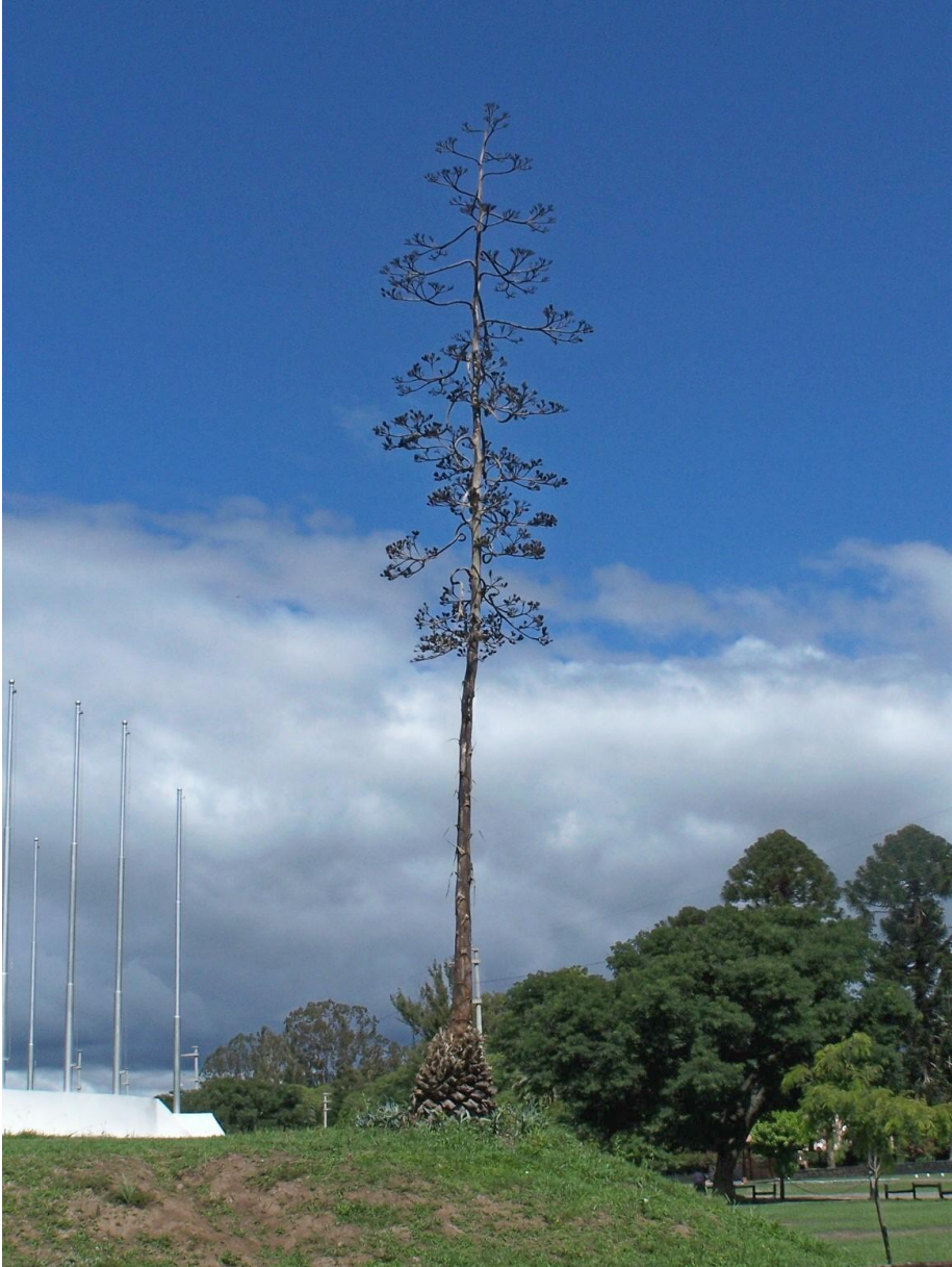
Foto 1. Agave americana.