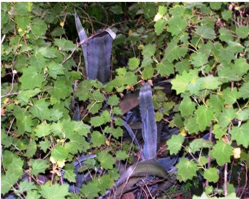
Foto 4. Ejemplar asilverstrado de Agave americana .