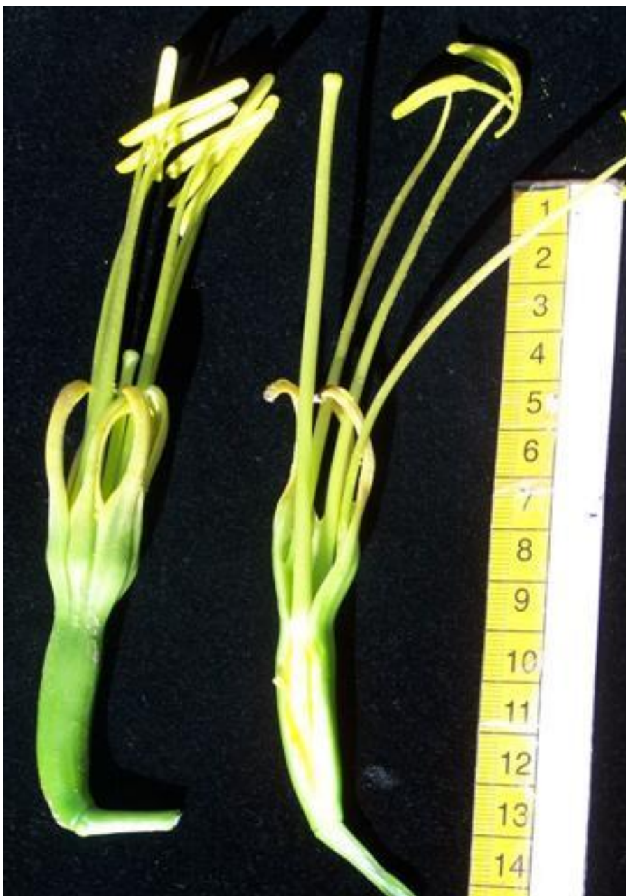
Foto 2. Agave americana . vista externa y corte longitudinal de flor en ejemplar cultivado.