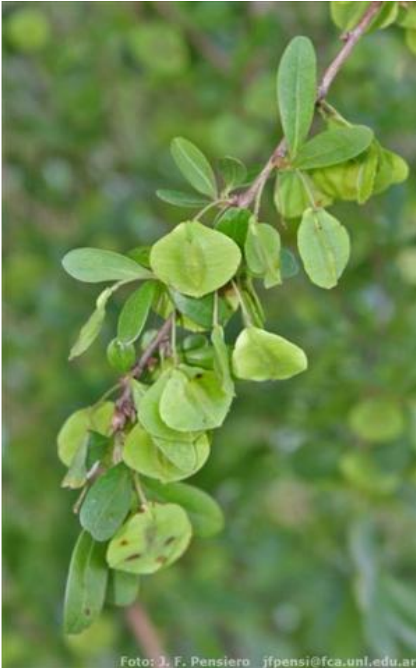
Foto 1. Terminalia triflora . Foto de J. F. Pensiero. Fl. Conosur. Darwinion.