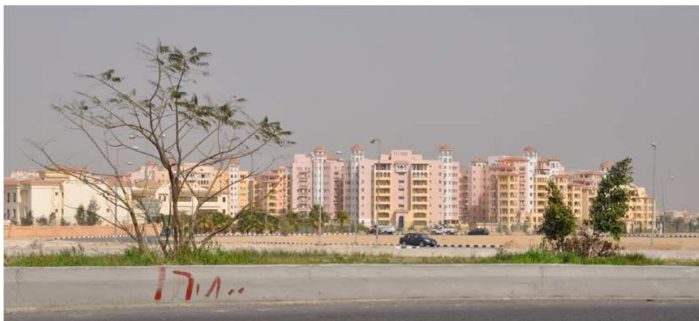
Figure 8. Complexe de logements de Dreamland , vue de l'extérieur