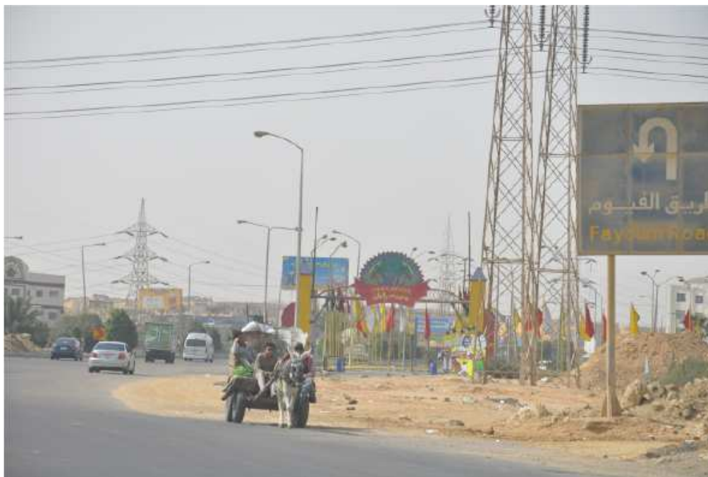
Figure 7. Entrée du Dream Park

des tombes et monuments égyptiens, aujourd'hui fermés aux touristes » ainsi que l'indique la plaquette publicitaire de Dreamland .