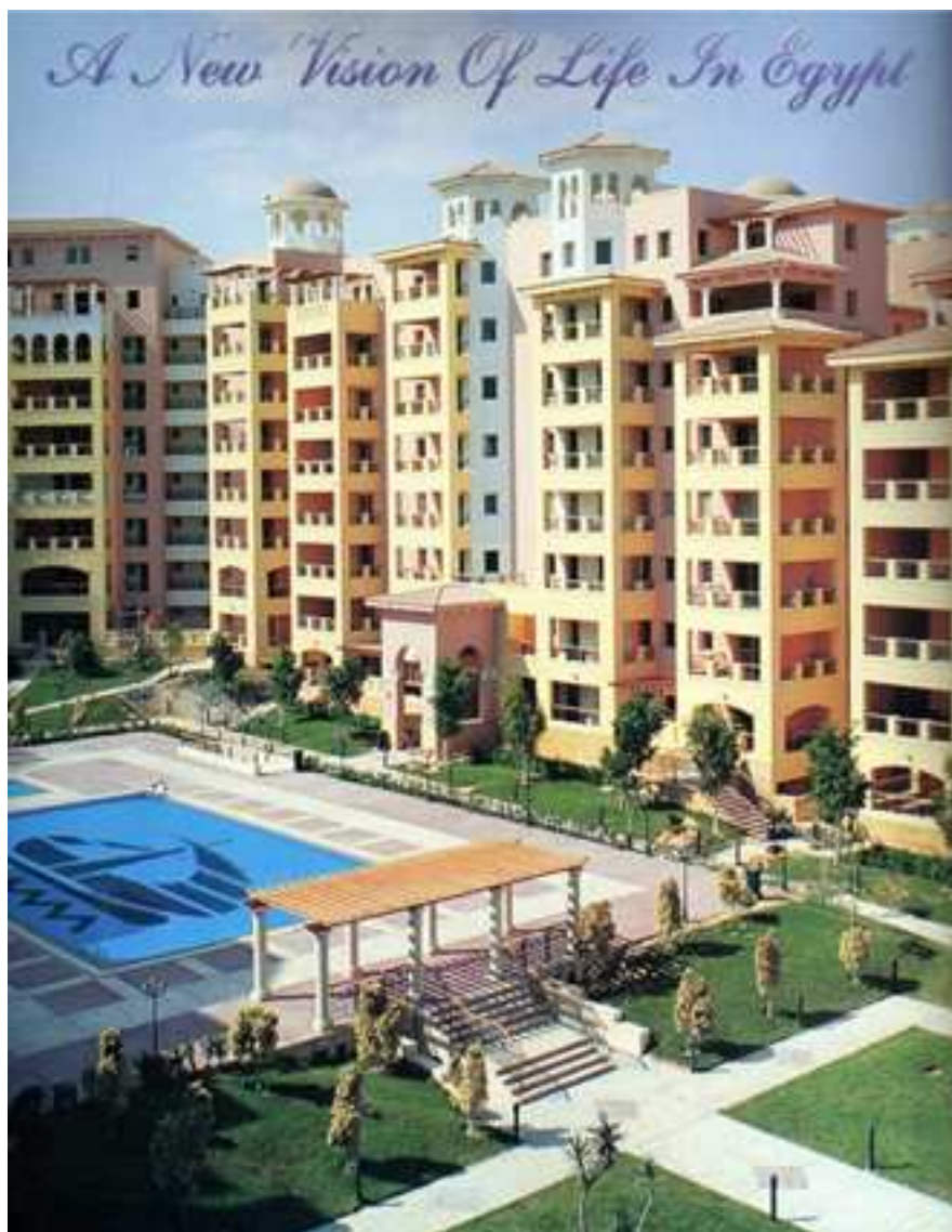
Figure 9. Complexe de logements de Dreamland , vue du cœur d'îlot