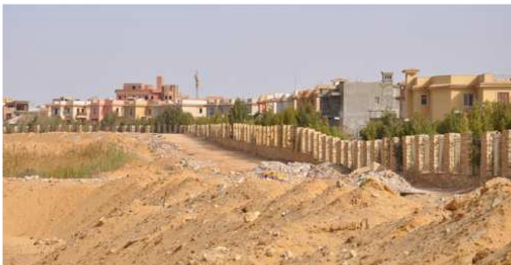
Figure 17. La fermeture « légère » du compound Al-Ashgar - Six Octobre