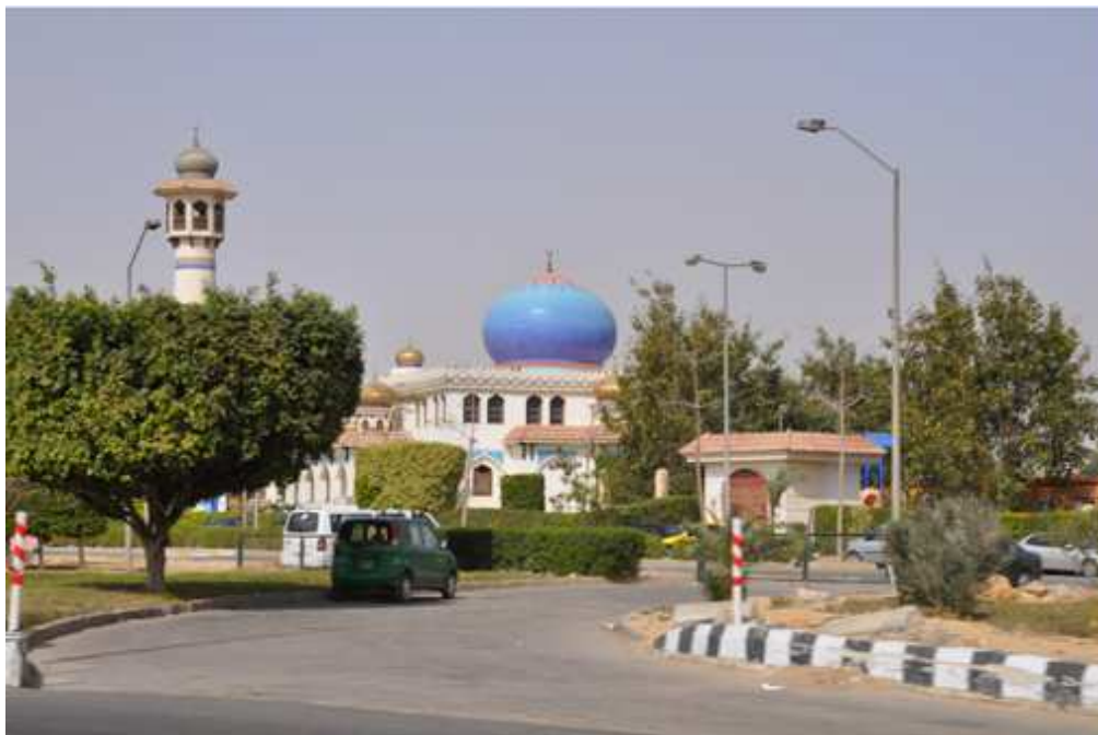
Figure 10. La mosquée de Dreamland

qu'il soit possible de rencontrer ses voisins dans un « club social au style pharaonique », ou de s'amuser, à Dreampark , avec des marionnettes humaines qui représentent Saladin et son grand vizir ou Pharaon – ceci dit, les boutiques vendent essentiellement des produits issus des grandes multinationales de jeux pour enfants – Titi le canari, Winnie l'ourson, etc. (Figure 11).