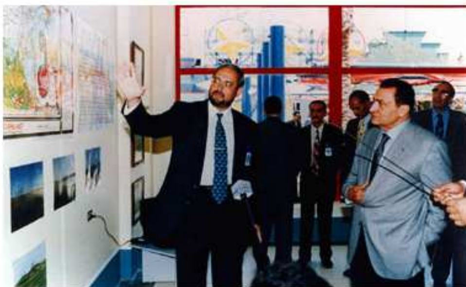
Figure 5. Sur le site internet de Dreamland, Ahmed Bahgat présente le master plan de Dreamland à Hosni Moubarak.