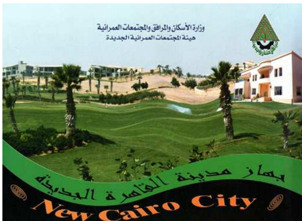
Figure 3. Dessins de villas présentées dans la brochure officielle de New Cairo .

Ministère de l'Habitat, des Services et des Villes nouvelles.