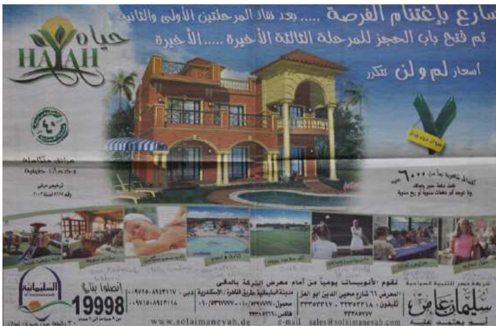
Figure 4. Publicité pour le compound Hayah à New Cairo (2008)

« Solaiman Amer, un nom sur lequel vous pouvez compter ! Solaimaneyah, 40 ans d'expérience ». Prix des villas : 6000 £e à la signature du contrat et 6000 £e mensuelles pendant 7 ans. Services proposés (petites vignettes de droite à gauche) : centre commercial, écoles de langues, club sportif et social, golf, hôtel cinq étoiles, thalassothérapie, restaurants différents, parc d'attraction pour enfants (NB : en 2008, 6000 £e valaient 850 euros).