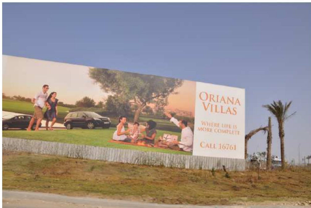
Figure 15. Panneau publicitaire pour le futur compound Oriana - New Cairo