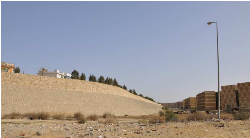
Figure 16. Le mur du luxueux compound Kattameya Heights surplombant les immeubles de la promotion publique New Cairo