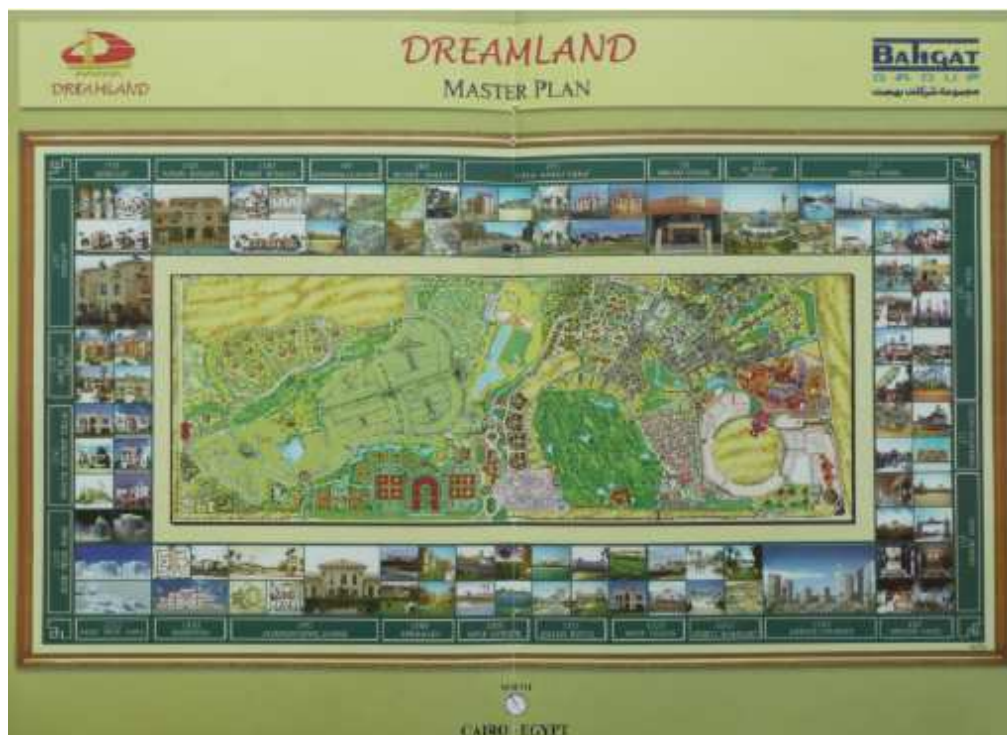
Figure 6. Master Plan de Dreamland