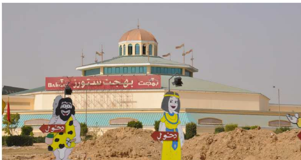
Figure 11. Le Dream Mall