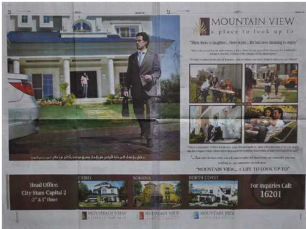
Figure 13. Double-page publicitaire dans le quotidien Al Ahram (mars 2008) pour le compound Mountain View - New Cairo