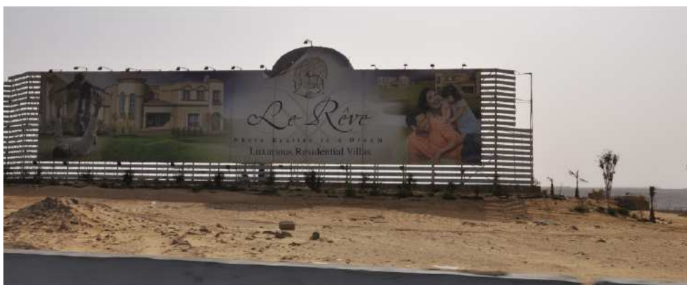
Figure 14. Panneau publicitaire pour le compound Le Rêve - New Cairo