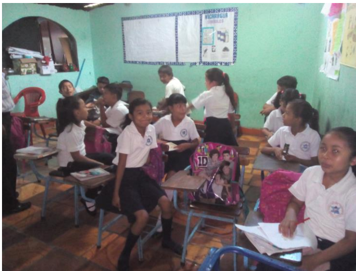
Este es el ambiente en aula de segundo grado