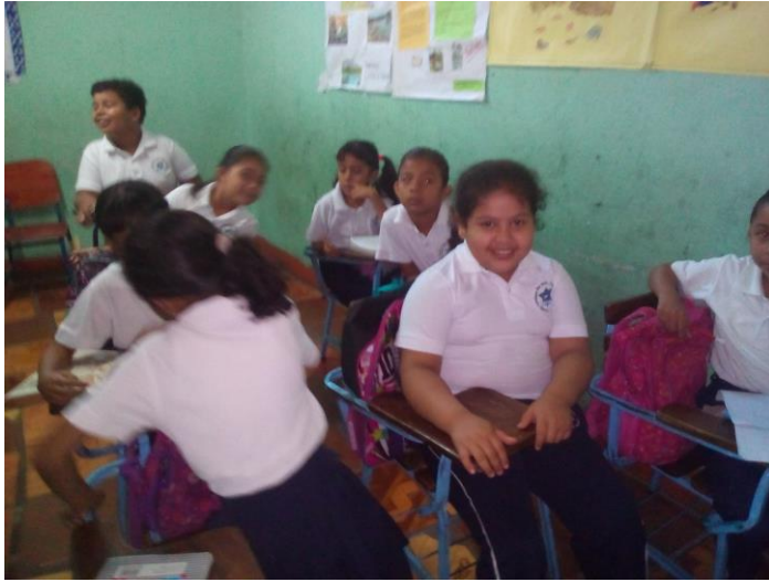
Alumnos de segundo grado a la hora de clases.