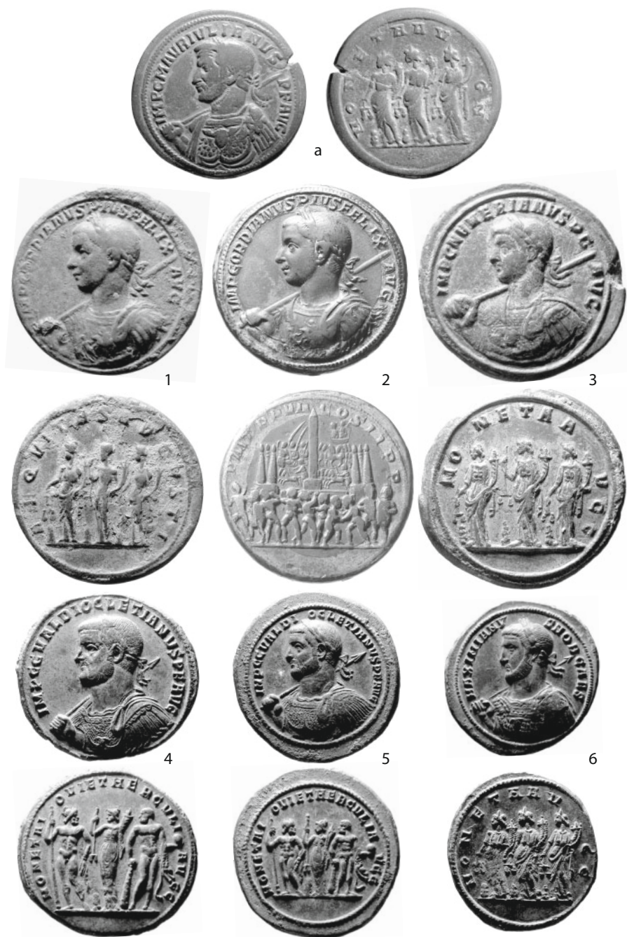
Planche 2 - Buste lauré et cuirassé à gauche, haste sur l'épaule droite – médaillons de comparaison.