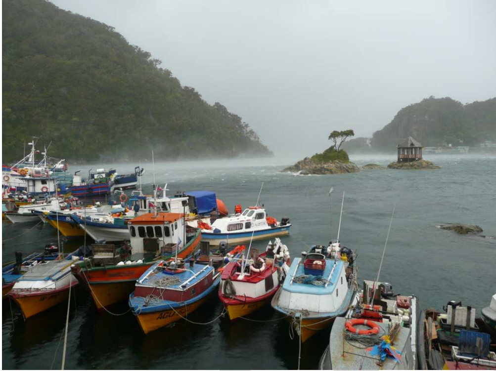
Figure 4 : botes de pêche artisanale bloqués par la tempête dans la baie de Puerto Gala (Cines).

Artisanal fisher boats ( botes ) stuck in Puerto Gala bay during a storm (Cines).