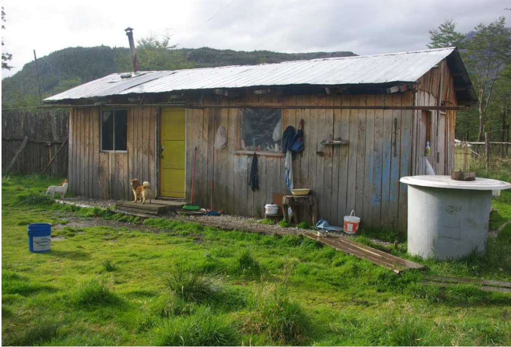
Figure 6 : Maison d'Olga, éleveuse installée depuis 55 ans dans le fjord Steffen. Olga, stock breeder in fjord Steffen, settled in this house 55 years ago.