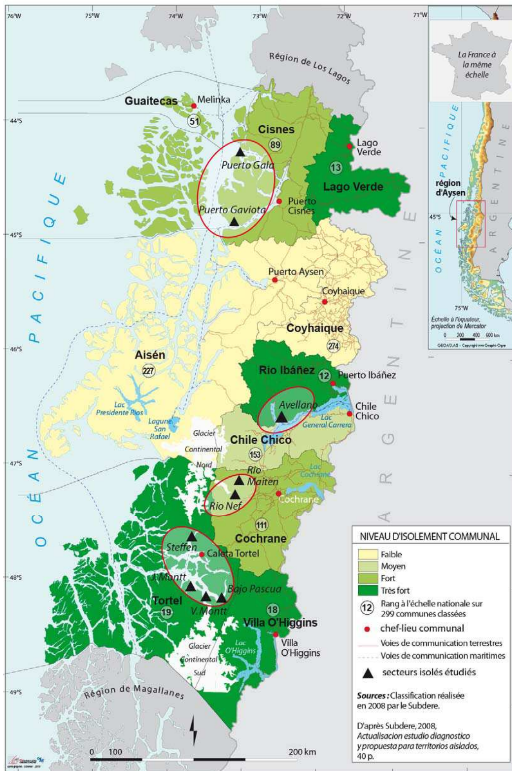
Figure 3 : La mesure de l'isolement en Aysén (Subdere, 2008). Remoteness evaluation in Aysén (subdere, 2008)