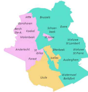
FIG. 4: Segmentation de Bruxelles en 3 clusters

Une étude locale de Bruxelles. Une étude des appels provenant des municipalités de la province de Bruxelles-Capitale vers l'ensemble de la Belgique permet de réaliser une segmentation locale à la capitale sans négliger les appels passés vers le reste du pays. Fusionner les clusters jusqu'à en obtenir trois permet de montrer une corrélation entre les clusters et la nature sociale des quartiers de la capitale Belge. En effet, sur la Figure 4, le cluster vert couvre les quartiers plutôt aisés de Bruxelles alors que le rose représente plutôt les quartiers populaires. Les deux villes du cluster orange sont d'importants centres étudiants.