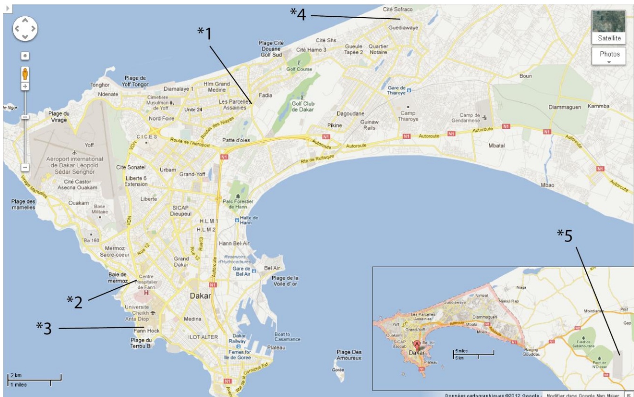
Figure 3 : Le réseau routier dans la région de Dakar (1 : Carrefour de Case-bah ; 2 : Poste Fann ; 3 : ESP de Dakar ; 4 : Guediawaye ; 5 : Aéroport international Blaise Diagne )

Pour améliorer la mobilité à Dakar, l'État sénégalais a commencé à restructurer le secteur et à créer, en mars 1997, un organe de coordination des transports urbains : le Conseil Exécutif des Transports Urbains de Dakar (CETUD) (Godard 2002). Puis s'est ajoutée, en décembre 2000, la société privée de transport public Dakar Dem Dikk qui compte près de 400 véhicules pour 17 lignes. Le transport urbain est aussi assuré par les récents minibus de l'AFTU avec près d'une trentaine de lignes, les autocars informels (cars rapides et Ndiaga N'diaye : environ 3 000 unités), les taxis urbains jaunes et noirs (environ 5 000 unités), et les taxis clandestins (DTT 2007; ANSD 2008). Cependant, après une décennie, les voyages pendulaires de masse, généralement réalisés dans des conditions difficiles, ainsi que l'importance qu'occupe la marche à pied dans le volume des déplacements (71%) (Trans-Africa 2009), laissent apparaître la faible adéquation de l'offre de transport, à la demande de mobilité, tant du point de vue quantitatif, que qualitatif.