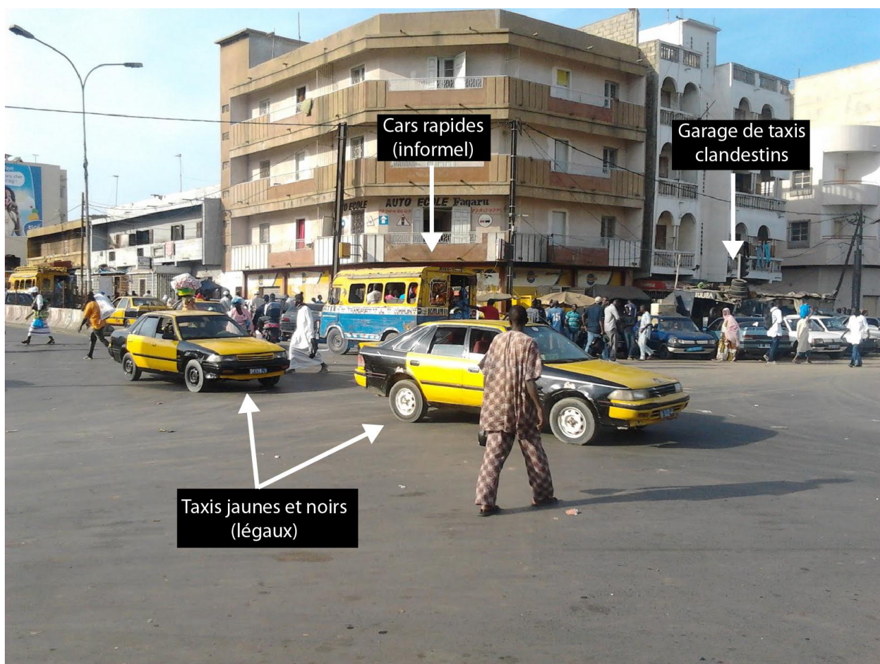
Figure 1 : Tally Boumack à Pikine : un carrefour majeur en banlieue dakaroise (Cliché : Adrien Lammoglia, 12/2011)

Les taxis clandestins de Dakar, communément appelés clandos (cf. Fig. 1) constituent un très bon exemple de transport informel. Que ce soit en banlieue ou en centre-ville, c'est un service de transport collectif, qui est encore aujourd'hui totalement illégal (ce qui n'empêche pas leur fonctionnement comme nous le verrons dans la deuxième partie). Il n'y a donc aucune entente et aucune organisation au niveau étatique malgré une tentative, sans succès, il y a quelques années, de formaliser le taxi collectif en banlieue. Ainsi, les chauffeurs n'obéissent à aucune règle particulière : ils n'ont pas nécessairement de permis de conduire, les véhicules sont rarement assurés et souvent en mauvais état. Le taxi clando est un service de transport artisanal. Il arrive parfois qu'un propriétaire possède plusieurs véhicules, et emploie plusieurs chauffeurs, mais bien souvent le propriétaire conduit lui-même son véhicule. Qu'il soit propriétaire ou non, le chauffeur du taxi est toujours responsable de son offre de transport, c'est-à-dire de ses itinéraires, de ses horaires, et de ses prix.