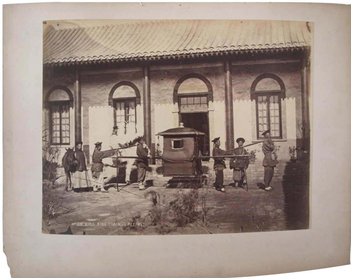
PH92-22 : Mandarin's sedan chair, Peking. Thomas Child, photographie prise entre 1870 et 1890. Epreuve à l'albumine sur papier, montage sur carton, porte au dos « Chaise à porteurs pour les mandarins » (annotation de Louis Dumoulin au dos du montage)

Cette photographie, mise en scène par Saunders avec des modèles pour simuler une exécution publique est également présente dans la collection d'un Anglais résidant en Chine, John Charles Oswald (1856-1900).