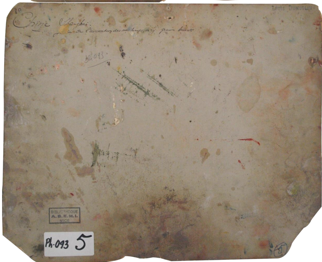
PH93-5 : Date et auteur inconnus. Epreuve à l'albumine sur papier, montage sur carton « Chine. Shanghai. Jardin de la Société des marchands de riz graines haricots » (annotation de Louis Dumoulin au dos du montage)