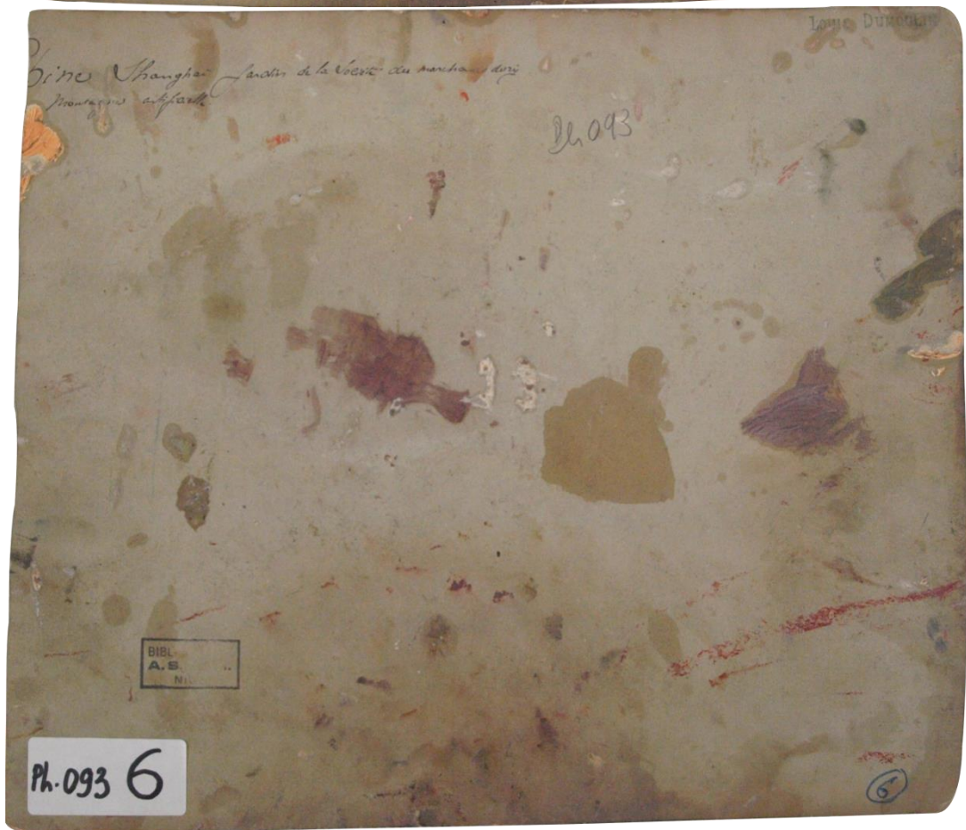
PH93-6 : Date et auteur inconnus. Epreuve à l'albumine sur papier, montage sur carton « Chine. Shanghai. Jardin de la Société des marchands de riz. Montagne artificielle » (annotation de Louis Dumoulin au dos du montage)

Un autre exemple ci-dessous dans la collection Japon de Dumoulin, à gauche une photographie de sa collection qui a servi de modèle au tableau de droite intitulé « Fête des garçons » (tableau réalisé en 1888