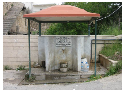
Figure 4 : Une borne-fontaine municipale à Chekka

Enfin, le dernier mode d'accès aux services d'eau potable constitue une « péréquation de fait », puisque il est considéré comme relevant de pratiques illégales. Un diagnostic, réalisé par approche théorique par un des cadres de l'EELN, permet d'estimer l'importance des fuites « techniques » et « non-techniques » (ou branchements illicites) : il y aurait 42% de pertes dues à des branchements « sauvages » sur le réseau d'eau potable alimenté par la source Kadisha. Ce dernier chiffre doit toutefois aussi se comprendre par l'importante quantité d'eau desservie, par rapport au forage Amioun- Dar Chmizzine alimentant Amioun