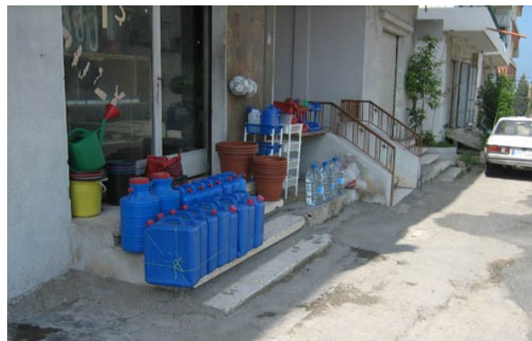
Figure 5 : Vente de galons dans un commerce de Chekka

où elles s'élèvent à 15% et au forage Jradeh où elles s'élèvent à 14%.