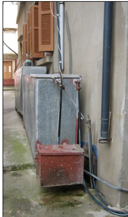
Figure 1 : Réservoir d'eau potable au rez-de-chaussée d'une maison d'Amioun

Ceux qui sont connectés au réseau d'eau potable d'Amioun doivent subir une distribution par roulement de l'eau en raison de la faiblesse du débit et du sous-dimensionnement des canalisations, qui ne permettent pas de desservir tous les quartiers en même temps. Pour faire face à un débit aléatoire et à un débit trop faible, les ménages s'équipent de réservoirs ou citernes - utilisés pour le stockage de l'eau - situés au rez-de-chaussée des maisons, souvent en extérieur, et équipés d'une pompe motorisée qui achemine l'eau jusqu'au toit vers un autre réservoir, assurant ainsi une distribution de l'eau dans les différents points d'eau de la maison de façon gravitaire.