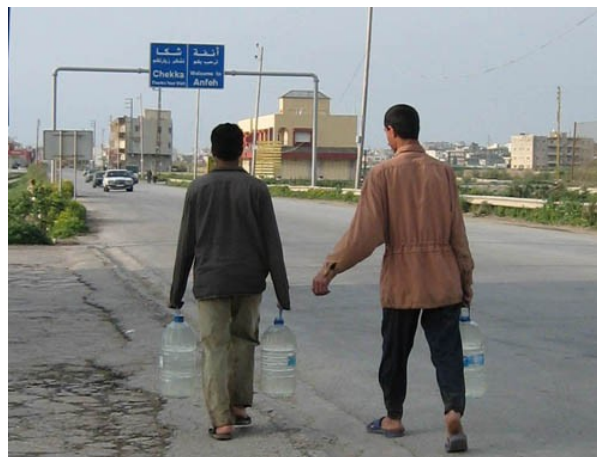
Figure 6 : La collecte d'eau par les habitants du quartier informel de Chekka

Enfin, la dernière stratégie, qui relève plutôt de l'adaptation précaire, correspond aux « solutions » de contournement du réseau par le « bas » par opposition aux « stratégies » des usagers influents : elle correspond aux pratiques illégales de branchement sur les réseaux qui permettent un accès au service public, ou aux pratiques dites de « système D » notamment pour la collecte quotidienne de l'eau, comme l'observation des pratiques des habitants du quartier non-réglementaire de Chekka le révèle.