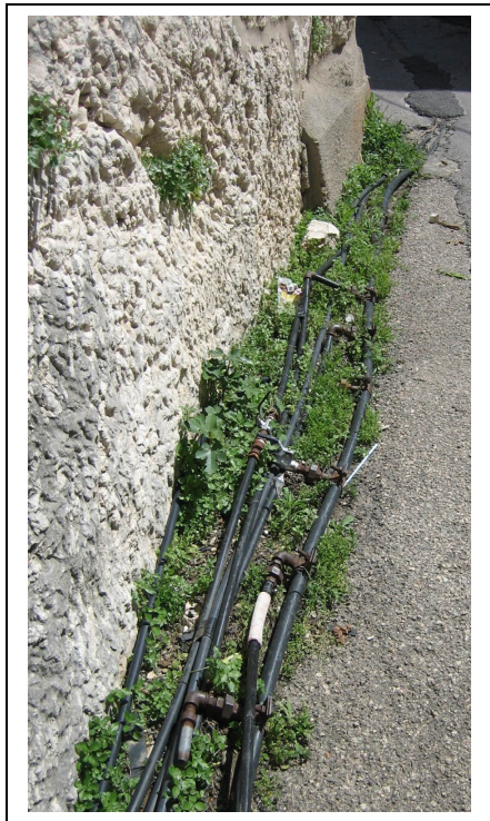
Figure 2 : Le réseau d'eau courant dans le vieux village d'Amioun

public de Jradeh. D'autre part, les infrastructures du réseau d'Amioun sont vétustes et sous-dimensionnées.