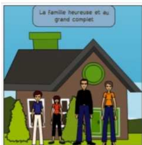
Figure 2 - Famille adoptive du sujet 4

Nous avons choisi de mettre en évidence ensuite des éléments concernant le rapport des sujets à leur identité personnelle. Ainsi, la façon dont les sujets se sont