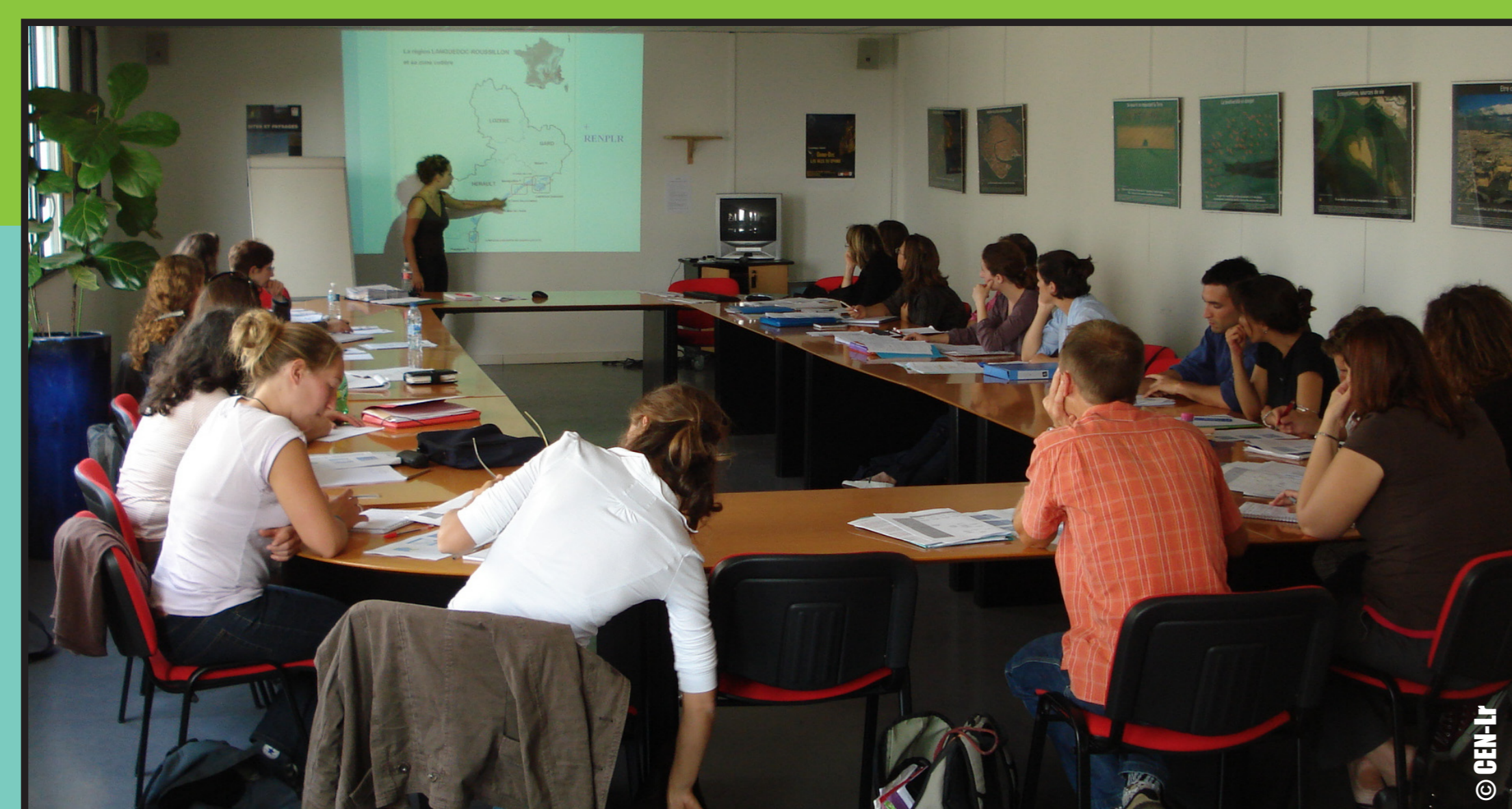
Travail de co-construction basé sur une mise en réseau d'acteurs