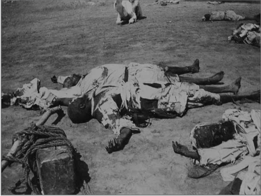
3. Cadavres du Khalifa ʿAbdullāhi et de l'émir ʿAlī wad Hilū gisant sur le champ de bataille d'Umm Dibaykrāt, près d'une réserve de munitions (24 novembre 1899). Reproduction autorisée par la bibliothèque de l'Université de Durham, SAD 621/6/4.

La seconde facette du contre-modèle britannique se construit autour de la sacralisation mémorielle du général Charles George Gordon (1833-1885). 52 Tué par les forces mahdistes lors de la prise de Khartoum en janvier 1885, cet officier profondément croyant vint à incarner l'archétype du martyr dans la mythologie de la communauté britannique du Soudan. 53 Le souvenir de sa mort héroïque contribua à rallier l'opinion publique anglaise au projet de « reconquête » du Soudan. Au cours du Condominium, la figure de Gordon