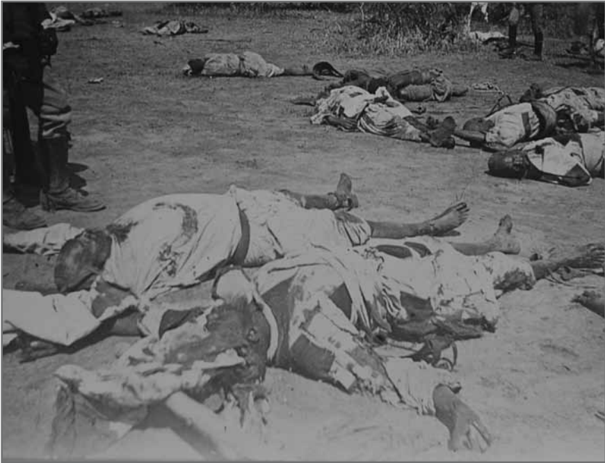
2. Cadavres du Khalifa ‘Abdullâhi (à gauche) et de l’émir Ahmad Fâdil gisant sur le champ de bataille d’Umm Dibaykrât (24 novembre 1899). Reproduction autorisée par la bibliothèque de l’Université de Durham, SAD 621/6/2.

timer le schéma patrimonial mahdiste tout en légitimant la présence impériale britannique au Soudan. En quoi consistait-il ? La première facette de ce contre-modèle mit en évidence les trophées de guerre des forces anglo-égyptiennes victorieuses. Au-delà des biens matériels pris au camp mahdiste, certaines représentations visuelles concoururent à accentuer le caractère misérable et repoussant des vaincus. Les photographies qui immortalisèrent la dévastation du tombeau du Mahdi par les canons britanniques et qui dévoilèrent les cadavres du Khalifa ‘Abdullâhi et de ses partisans sur le champ de bataille remplirent cette fonction tout en donnant à voir des preuves incontestables de l’échec mahdiste (cf. fig. 1, 2 et 3). 51