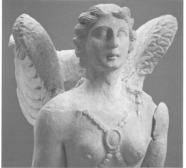
○ Fig. 6. Sphinge (99 03 DA 028 et DA 029), détail du torse.

descendent des épaules sur la poitrine, où ils se rejoignent entre les deux premiers seins par un médaillon arrondi, ils se dirigent vers le dos, où ils s'arrêtent sous la partie inférieure des ailes. L'avant-bras droit, brisé, est légèrement relevé, ce qui indique que la main était également posée sur quelque chose, probablement une tête humaine. Les ailes sont bien déployées, parallèles au corps et recourbées vers le haut à leurs extrémités. Le buste est assez puissant, le monstre a six paires de seins qui n'ont pas toutes reçu le même traitement. La première paire, mise en valeur par le pectoral et plus proche du visage est humaine, tandis que les autres se rapprochent davantage de l'aspect de l'anatomie animale.