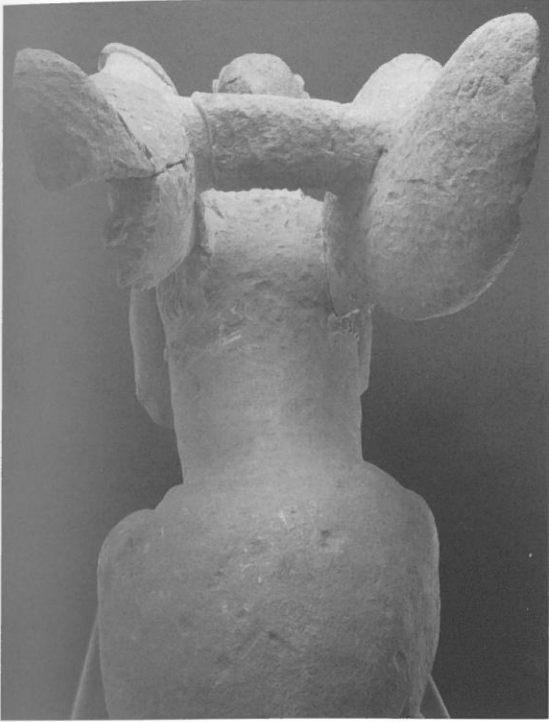
○ Fig. 5. Sphinge (99 03 DA 028 et DA 029), vue du dos.