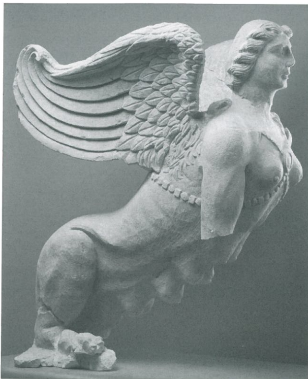
○ Fig. 4. Sphinge ( 99 03 DA 028 et DA 029), profil gauche.