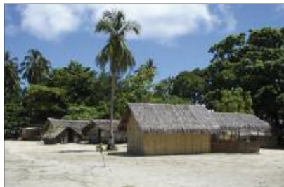
Un village côtier (Yugemène, Hiw, Torres)

Ce livret propose d'accompagner le lecteur dans ce voyage musical. Après avoir évoqué la place de la musique dans les sociétés du Vanuatu, nous présenterons leurs instruments de musique et décrypterons l'art de la poésie chantée. Enfin, l'auditeur pourra suivre le déroulé de l'album et le détail des 41 pièces à la découverte de l'univers musical de l'archipel.