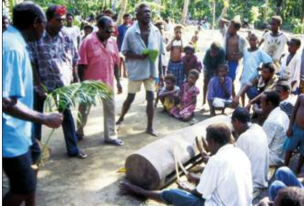
Singers and drummers around the wooden slit gong nokoy (Avay, Motalava)

be heard in the recording: the main song (“E ale...”); the joyful cries of the dancers; a fast-tempo, continuous beat (called beleg in Mwotlap) played with fine wooden sticks by the two percussionists seated on both ends of the drum; finally, a discontinuous, more muffled rhythm ( bōl ) beaten by the main drummer, the one who is seated facing the middle of the instrument.