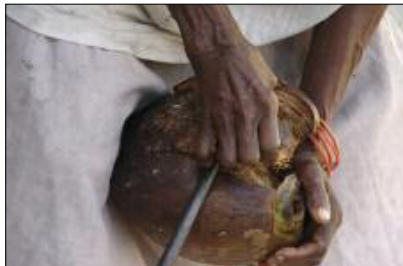
Coconut husking

The poem has two levels of reading. At first sight, this is an innocent physical competi-