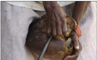
L’écorçage de noix de coco

[ En écorçant les cocos, chant titi, Vanua Lava ]