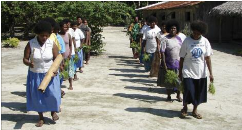
The women's dance rurumbē (Hiw, Torres)