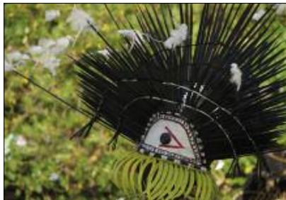
The spirit of the Urchin, neqet dance (Lahlap, Motalava)

One context in which music also formalises the bond between the living and the dead is that of secret societies (Vienne 1984, 1996). Boys of a same age group gather together, somewhere in the forest, under the aegis of a protective divinity, and learn from their elders a number of songs, dances and instruments reserved to the initiated. At the end of this period of reclusion, these