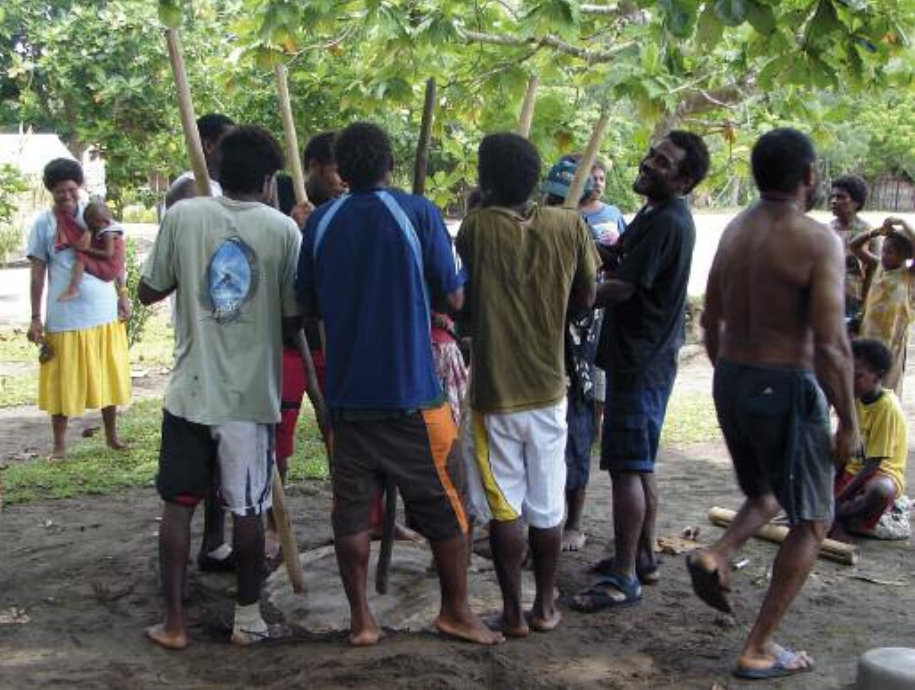
Une fête newët / A newët party (Yaqane, Hiw)