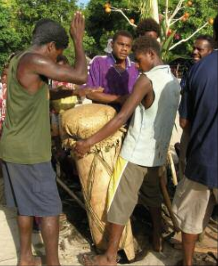
Le tambour à membrane lors d'une séance de nawha titi (Toglag, Motalava) © MS

les autres musiciens. C'est à ce moment que l'orchestre titi donne sa pleine puissance, à travers tous ses instruments et toutes ses voix. D'ailleurs, le terme titi lui-même trouverait précisément son origine dans cette forme responsoriale – à partir d'un ancien verbe ti ou titi "répondre". Cette alternance du soliste et du chœur obéit à des schémas assez réguliers, que l'on entend bien dans le disque, et que nous analyserons dans la description des pièces.