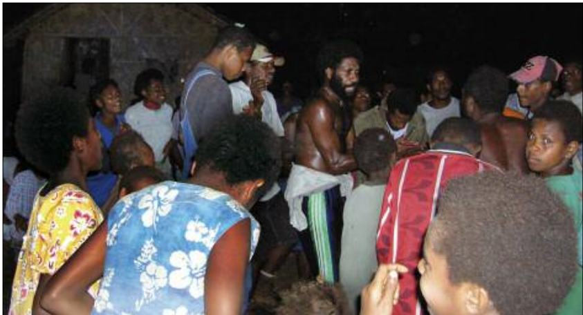
A sawagoro night session (Umulongo, Maewo)