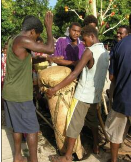
The single-headed drum during a nawha titi session (Toglag, Motalava)

In each titi piece, there is always a fleeting moment when the instruments suddenly stop ( yak in Mwothlap), before starting up again with even more fervour: this is heard at 0’56”, 1’39” and 2’35” in the song of the Rain [⊙25], at 1’26” and 2’26” in Liana flower [⊙27], at 1’04” and 2’46” in Volcano [⊙29]. This technique emphasises the group’s cohesion and strength.