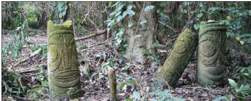
A spiritual stele dule in the forest (Toga, Torres)

The ghosts of our ancestors are never far away: they live on all around us, and guide the lives of mortals. Only the initiated have access to their universe, their secrets, their language. Some men endowed with supernatural power – shamanic healers, soothsayers, sorcerers – can even interact with