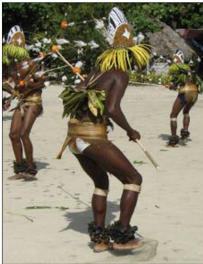
Ankle rattles for neqet dance (Lahlap, Motalava)

They are widely used in the Banks islands, especially in masked dancing performed by young initiates – whether the young men's dance called utmag in Merelava [☉36] or the spectacular neqet dance [photo] in Motalava [☉37]. In all these dances, the concussion of the dried nuts together accompanies the sharp striking of the small slit drums and the voices of the soloist singers, in a very characteristic musical soundscape.