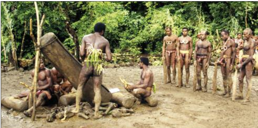
Grade-taking ceremony in Bunlap (South Pentecost)

In the islands of Pentecost, Ambae and Maewo the slit gong has preserved its original tie with graded societies, an institution still very much alive today. Among the attributes associated with certain grades are precisely certain drumming rhythms: these are always played on a group of several wooden drums of varying sizes [photo below]. In the