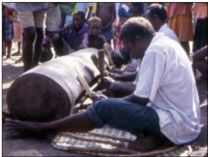
Tambour à fente nokoy (Motalava) © AF

Dans la majeure partie de l'archipel, cet instrument sera ainsi joué dans une formation de plusieurs tambours (Crowe 1996), chacun joué par un seul musicien. Aux îles Banks en revanche, plusieurs musiciens frappent le même tambour – lequel suffit, à lui seul, à produire une polyrythmie [photo ci-contre]. Dans les îles de Motalava et de Gaua, ce lourd tronc évidé fait environ 1,40 m de long pour un diamètre de 45 cm. Posé au sol, il est joué par trois musiciens assis. Celui du milieu percute le centre du tambour à l'aide d'épais pétioles de palmes de cocotier, produisant les basses ( bōl en langue mwotlap de