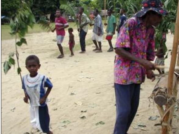
Noyongyep dances for a wedding

For the morning church ceremony, the bride and groom wear western clothes – suit and tie for the groom, white dress and veil for the bride. The moment they leave the church, the percussions begin to play for the dancers. The small group of musicians and singers, standing around the percussion board and drums, is soon surrounded by a line of dancers. The newlyweds lead the procession, surrounded by their respective families, moving in circles around the musicians. Gradually other villagers, young and old, from all over the island, join in the dance and enlarge the circle. Everyone moves forward in a line, without touching each other, in small steps to the rhythm of the drums [photo]. Sometimes several lines are formed, crossing over on the arena. The male initiates form their own line, and mark their particular status by holding a Cycas palm , a symbol of chieftom in olden times; little boys imitate them, holding just any branch. When the place is full of dancers, the rhythm suddenly accelerates (this is very