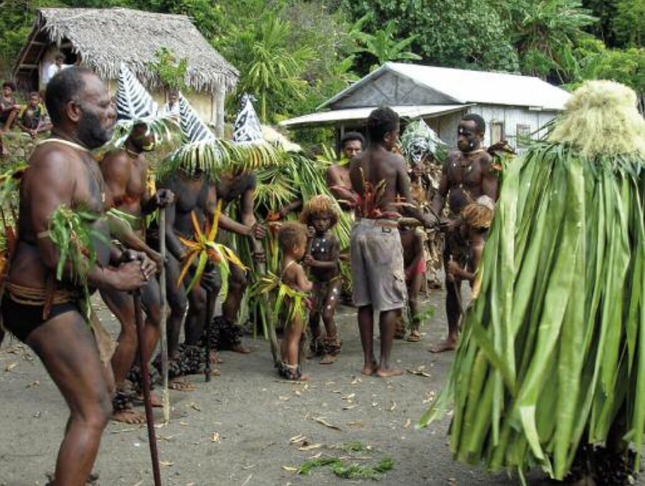
Utmag, danse des initiés / dance of initiated men (Merelava)