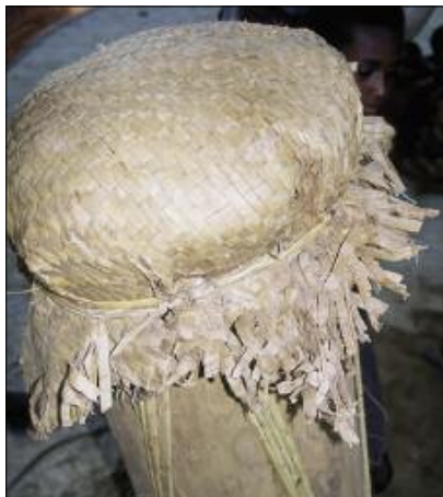
Tambour à membrane natmat-woh (Motalava)

D'une part, sur l'île de Maewo, un tambour à membrane existe encore, mais sa fabrication n'est connue que de quelques individus. Ce tambour se nomme tağura , c'est-à-dire "sagoutier", du nom du bois dans lequel il est fabriqué. Instrument tabou, il est utilisé lors d'une cérémonie exceptionnelle, Ġwatu ta Baruğū , à l'issue de laquelle il doit être détruit. Le nord des îles Banks possède également un tambour à membrane fabriqué dans un sagoutier. Après avoir évidé le tronc de sa pulpe, on obtient un fût d'environ 1,40 m de long et 40 cm de diamètre. On en recouvre