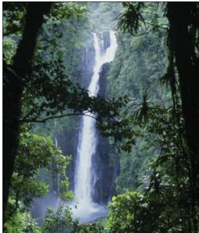
The great waterfall of Gaua