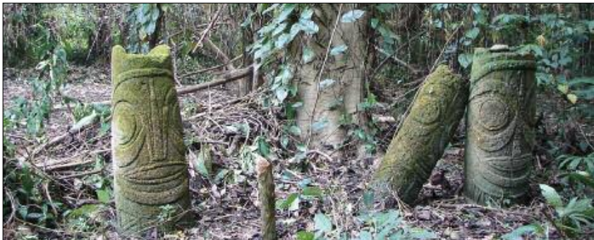
Stèles des esprits dule dans la forêt (Toga, Torres)

Les ancêtres et les morts vivent autour de nous, et nous guident dans nos vies de simples mortels. Seuls les initiés ont accès à leur monde, à leurs secrets, à leur langage. Certains hommes aux pouvoirs surnaturels – guérisseurs, devins, chamanes – peuvent même les voir dans leur monde (le Panoï ) et interagir avec eux. Ces sorciers reviennent alors dans le monde des vivants (le Marama ) pour exhiber les mystérieuses beautés qu'ils auront découvertes.