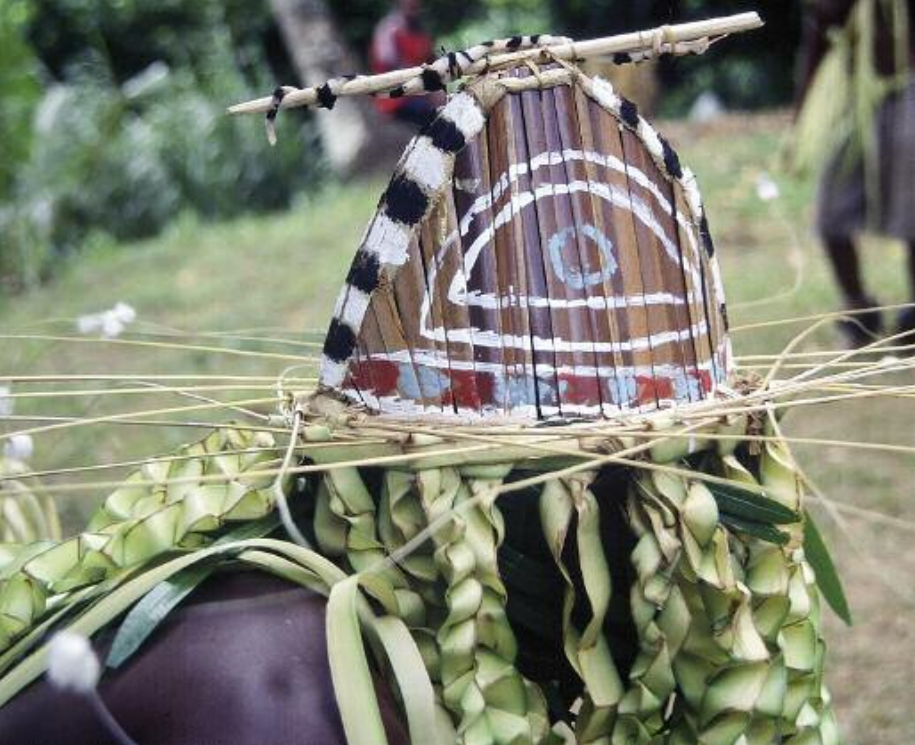
Le regard du Maraw , esprit de la danse mag / The eye of the Maraw , spirit of the mag dance (Jölap, Gaua)