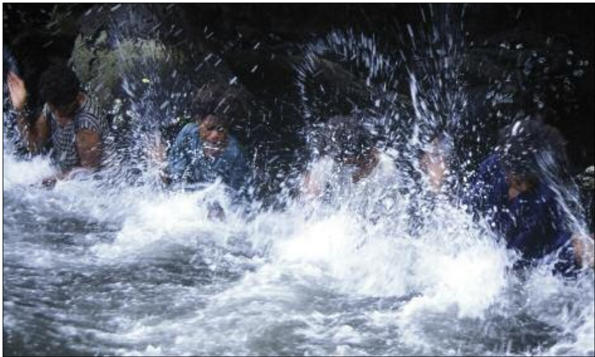
Water games in the river (Qtevut, Gaua)

the water, “slap” it ( wes ), or “smack it sharply” ( vuh tēqēl ). A light sound may be produced by putting just two fingers into the water ( gisgis ) and a heavy sound by suddenly plunging both fists ( wej ). The leader’s signal ( puow ) indicates a sequence is about to finish. A sequence may be played twice: the first time together, and the second in two staggered groups – like a canon – resulting in a two-part polyrhythm: this is the case for sequences 2 and 3 in the recording.