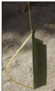
Bullroarer made out of a coconut leaf

The double rotation of the instrument – simultaneously above one’s head and on its own axis – results in a loud, deep humming sound. This recording features not just one, but three bullroarers – which together produce a truly powerful effect.