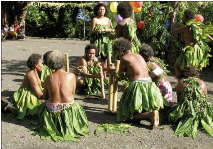
Stamping tubes for nombo dance (Merelava)

called nombo (“bamboo” in the local language). Six women, squatting or sitting in a circle, hold a short bamboo tube in each hand [photo], and strike the ground while they sing [©11]. Another type exists in Pentecost. Longer, and played in larger numbers than in Merelava, these bamboos