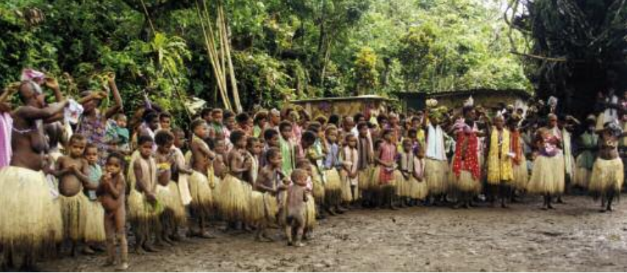
Women and children during festivities in Bunlap (South Pentecost)

A key element could possibly explain this dichotomy between these two categories of music: namely, the islanders' capacity to control the full chain of production. Customary music – even when it circulates from one island to another, and is thus not “local” strictly speaking – will always involve instruments and techniques that can be readily reproduced from local resources; in these conditions, it is easy for the islanders to learn new styles and enrich their inherited repertoire. By contrast, music of European origin often implies the use of materials (metal, plastic...) and foreign instruments that can be harder to recreate locally. Taking on the perceptions of the musicians themselves, the present anthology will focus