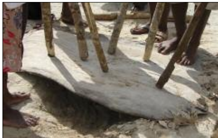
Planche à percussion tiyit rërë (Hiw, Torres)

Un idiophone assez répandu au Vanuatu, notamment dans les îles du nord, est la planche à percussion. Après avoir creusé dans la terre une petite fosse d’environ 50 cm de diamètre et 20 cm de profondeur – elle servira de résonateur – on pose dessus un morceau de bois assez massif, plus ou moins plat. Traditionnellement, cette planche est issue d’une racine-contrefort, plate et large, de certains arbres ; de nos jours, on peut y substituer n’importe quelle planche de bois. Trois à douze musiciens se tiennent debout autour de cette planche. Chacun est muni d’un ou deux bâtons plutôt légers, longs de 0,90 à 1,80 m, soit en bambou soit en bois