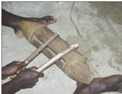
Tambour à fente en bambou (Motalava)

Dans les langues du nord du Vanuatu, ce petit tambour à fente est toujours distingué de son grand frère, le grand tambour à fente taillé dans un tronc d'arbre. Par exemple, la langue lakon (ouest Gaua) désigne le grand tambour comme kee , et le petit comme qalē laklake (littéralement "entrenœud-de-bambou à danser").