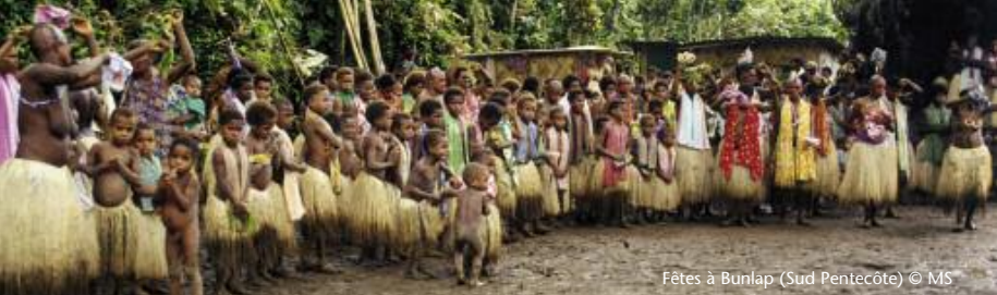
Fêtes à Būnlap (Sud Pentecôte)

Ce contraste entre musiques “locales” et musiques ressenties comme exogènes peut surprendre, lorsque l’on connaît la circulation constante des formes musicales entre communautés, qui souvent voyagent d’une île à l’autre de l’archipel. En d’autres termes, les musiques “d’ici”, que l’on assigne à la “coutume”, sont souvent déjà des musiques d’ailleurs, arrivées un jour par la mer. Malgré cela, un contraste subsiste dans les perceptions, entre une musique de la “coutume” et des formes qui n’y appartiendront jamais vraiment ( string band , chants d’église). Il est possible qu’un élément clef puisse expliquer cette dichotomie entre ces deux catégories de musique : la capacité des insulaires à en maîtriser toute la chaîne de production.