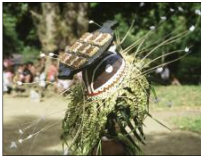
Coiffe de la danse mag , en forme de plat cuisiné (Jöla, Gaua)

Musicalement, le qat tout comme le mag ne mettent en jeu que deux instruments : le petit tambour à fente – joué par un musicien debout au centre de la place – et les sonnailles aux chevilles des danseurs.