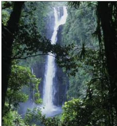
La grande cascade de Gaua

On peut lire ainsi les paroles des poèmes Pluie [©25], ou Volcan [©29]. Au passage, on notera la présence, dans plusieurs de ces poèmes, d’un même composé verbal sol duñ , littéralement “s’écouler retentir” dans la langue poétique. Sans équivalents dans la langue parlée, cette expression constitue un cliché poétique dans la langue des chants de Motalava : elle saisit le contraste entre la normalité d’un liquide qui coule ( sol “s’écouler”), et la surprise suscitée par un soudain bruit de choc ( duñ “retentir”). Dans le poème Le Fracas des Brisants cité plus haut, sol duñ traduit la force des vagues qui viennent se