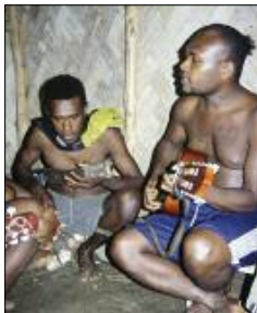
A stringband session in the village (Jölap, Gaua)

All in all, these two musical universes coexist without really mixing. Guitars commonly played in churches or in string bands never participate in “custom dances”. The contrast is also found in the language: whereas religious or string band songs are often in Bislama or English, this is never the case with customary songs: whatever the style, their lyrics are always composed in the local tongue, or sometimes even in an archaic, poetic language. These styles, typical of ancient music, preserve their distinctive identity even in contemporary creations: as