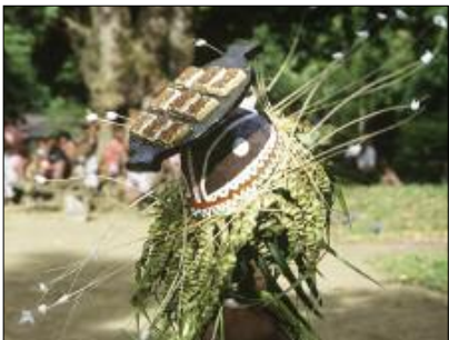
Headdress from the mag dance, in the shape of a cooked dish (Jôlap, Gaua)

The second dance, quite similar, is called qat (pronounced [kpwat]) – or more precisely: qat in Mota, Dorig and Lakon, qet in Vurès, neqet in Mwotlap and in Mwerlap. This name is historically linked with the name of Qat or Qet, the divinity of origins (François 2013). Just like the mag , the qat is for male initiates only, but from a higher grade.