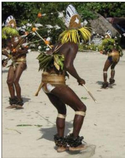
Sonnailles de chevilles dans la danse neget (Lahlal, Motalava)

Connues dans tout l'archipel du Vanuatu et au-delà, les sonnailles sont fabriquées à partir des fruits d'un végétal, Pangium edule , sorte de noix dont les coques sont vidées puis séchées au soleil, avant d'être tressées en grappes. La particularité de cet instrument est d'être normalement joué non par les musiciens, mais par les danseurs : les sonnailles sont attachées à leurs chevilles, et s'entrecho-