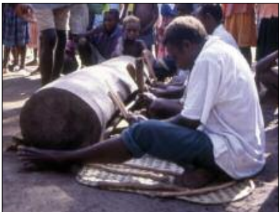
Slit gong nokoy (Motalava)

of Motalava, tēn in Lakon); the two drummers each side of him play with hard, lightweight sticks, producing a higher and more powerful sound ( beleg in Mwotlap, vuh in Lakon). The pattern is thus polyrhythmic, with each musician striking a different ostinato.