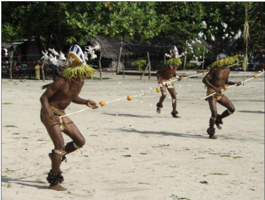
Dance of the spirits, the neqet (Lahlap, Motalava) © AF

only be sung silently by the dancers, in their heart of hearts. The only sounds heard are not articulated words, but some form of shouts – either signals thrown by the key drummer (“ Hiy sito! ”), or the growling of the ancestors themselves.