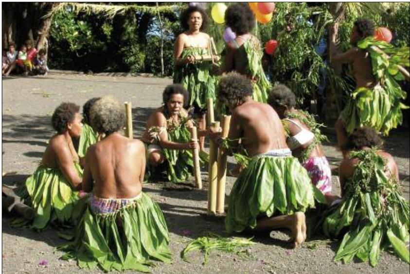
Bambous pilonnants dans la danse nombo (Merelava)