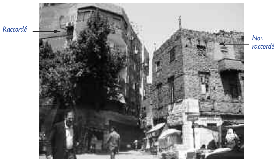
Illustration de l'exclusion urbaine d'un quartier taudifié (et objet d'une future opération immobilière) situé entre la rue El Horeyya et Ahmed El Orabi dans le quartier de Agouza