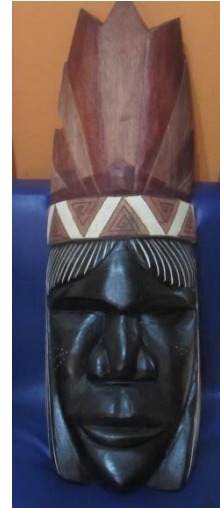
Foto 8 DESPUES: Máscara tallada en Palo Cuchara acabados en comaca roja (corona) y negra (rostro), con gradaciones de color y alto contraste Leticia – Amazonas – 30/11/2014