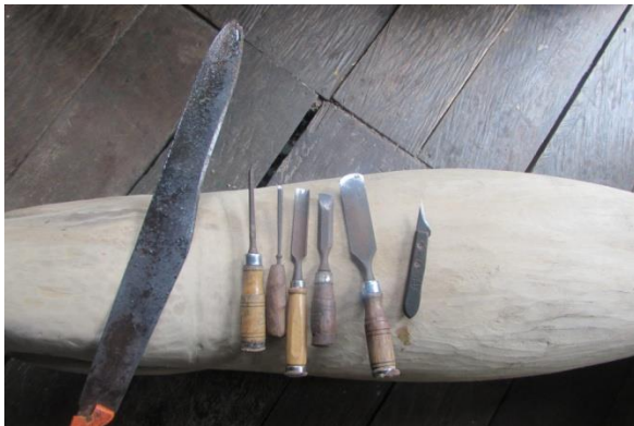
Foto 5 Mal estado de las herramientas – Taller Ruperto Ahuanari, casco urbano. Puerto Nariño – Amazonas – 06/10/2014