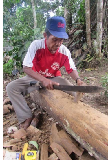
Foto 2 Taller de Eliécer Valerio, puesto de trabajo, Tomada por: DI. Adriana Sáenz F. Puerto Nariño, Comunidad 20 de Julio – Amazonas – 11/08/2014, Fundación Etnollano