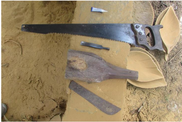
Foto 3 Herramienta de corte y talla, taller Edinson Paima. Tomada por: DI. Adriana Sáenz F. Puerto Nariño, Comunidad 20 de Julio – Amazonas – 11/08/2014, Fundación Etnollano