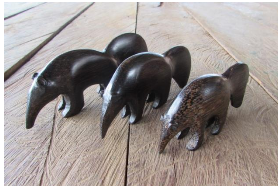
Foto 10 Familia de Hormigueros tallados en Pona por Eliécer Valerio Tomada por: DI. Adriana Sáenz F. 20 de Julio – Amazonas – 22/11/2014, Fundación Etnollano