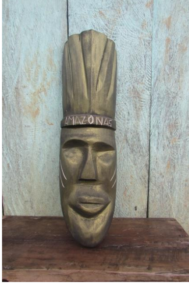
Foto 7 ANTES: Máscara tallada en balsa, acabado pinturas industriales, Tomada por: DI. Adriana Sáenz F. 20 de Julio, Puerto Nariño – Amazonas – 21/09/2014, Fundación Etnollano