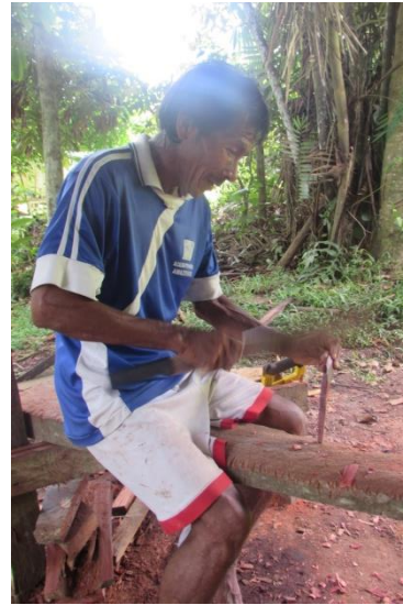
Foto 4 Taller Manuel Gómez, 20 de Julio Puesto de trabajo, Tomada por: DI. Adriana Sáenz F. 20 de Julio, Puerto Nariño – Amazonas – 11/08//2014, Fundación Etnollano