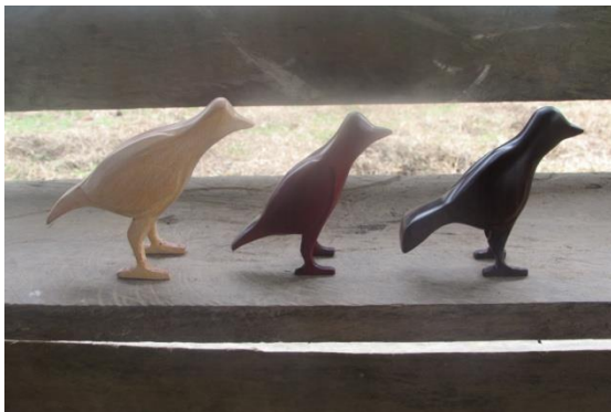
Foto 9 Juego de pájaros (Arrendajos) tallados en Incira, Palosangre y tawarí por Manuel Gómez Tomada por: DI. Adriana Sáenz F. 20 de Julio – Amazonas – 22/11/2014, Fundación Etnollano