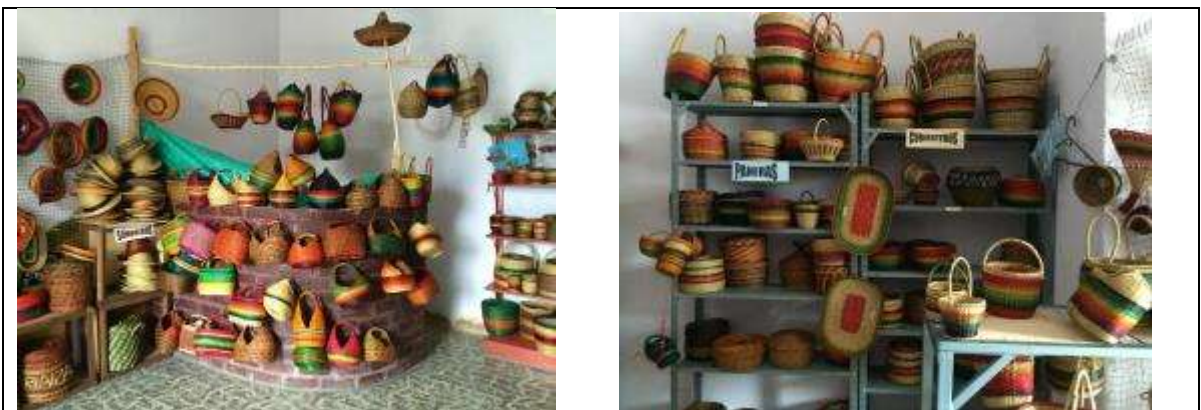
Área de Exhibición – ADAUC