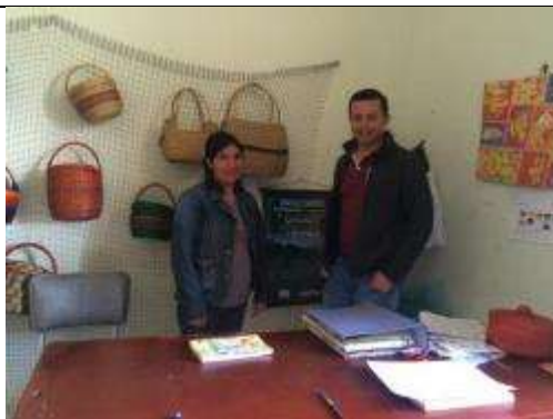
Punto de Venta ASAVAC - Secretaria Artesanías de Colombia S.A. – Fundación CEDAVIDA Cerinza – Boyacá Noviembre de 2014

Mercado Regional: Las asociaciones artesanales ofrecen esporádicamente sus productos en sitios turísticos y artesanales del departamento de Boyacá, tales como Villa de Leyva, Paipa, Tunja.