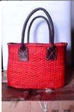
Producto Nuevo – Grupo de artesanas de Cerinza Foto: Patricia Valenzuela Artesanías de Colombia S.A. – Fundación CEDAVIDA Cerinza – Boyacá Noviembre de 2014

Este producto va dirigido a diferentes tipos de almacenes que requieran accesorios de moda, artículos de playa, entre otros.