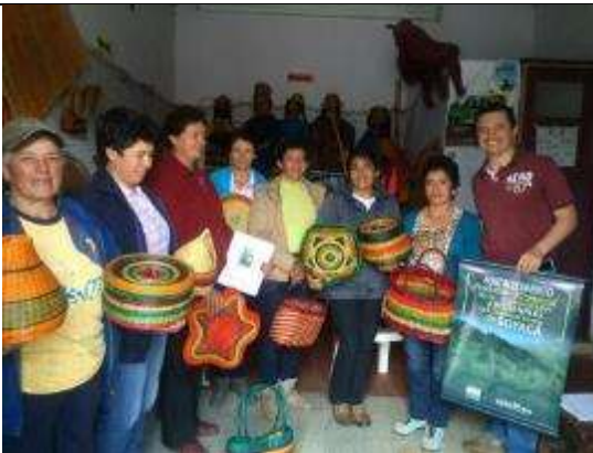
Punto de Venta ADAUC – Grupo de artesanas Artesanías de Colombia S.A. – Fundación CEDAVIDA Cerinza – Boyacá Noviembre de 2014

El mercado local , está ubicado en el municipio de Cerinza, cuya característica principal es ofrecer productos a los visitantes, turistas en los puntos de venta de ASAVAC y ADAUC.