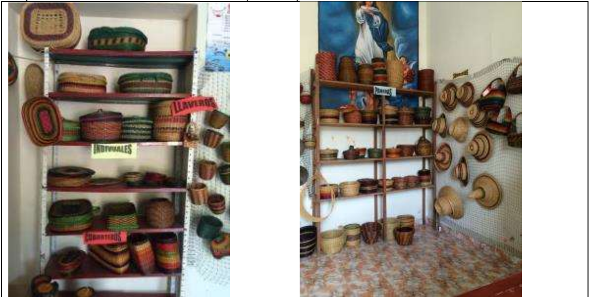
Área de Exhibición – ASAVAC

Ubicación: Las asociaciones tienen su propio espacio para almacenar el producto terminado e inclusive para almacenar materiales. Ambas asociaciones tienen espacios para realizar reuniones, atender a los artesanos y recepción para pagar el producto terminado, además espacios para atender clientes.