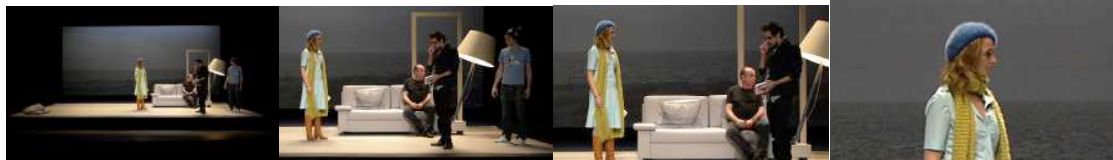
Figure 2: Scénoptique : trois recadrages d'une captation haute définition sur la scène des Célestins.