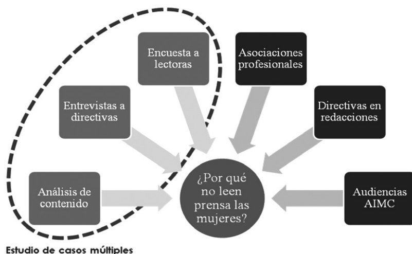
Ilustración 1 Triangulación metodológica de investigación