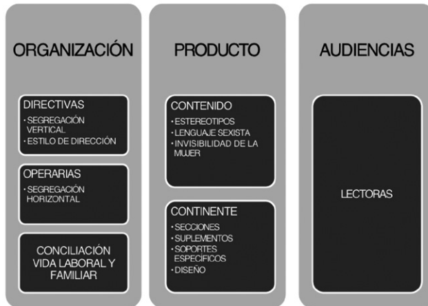
Ilustración 3 Grupos de categorías utilizados