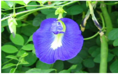
Gambar 2. Bunga Telang ( Clitoria ternatea L.) (Manjula, 2013)

Selain sebagai pewarna antosianin yang terdapat pada bunga telang dapat bersifat sebagai antioksidan yang dapat digunakan sebagai obat tradisional yang dapat bermanfaat bagi kesehatan tubuh. Menurut Maksana et al. (2017), kelebihan dari bunga telang cukup memberikan manfaat yang baik bagi industri pangan diantaranya dapat meningkatkan atribut mutu pada warna makanan bunga telang juga dapat memberikan manfaat kesehatan jika ditambahkan atau digunakan sebagai pewarna makanan. Menurut Mukhriani (2014), untuk memperoleh antosianin pada bunga telang salah satunya adalah dengan cara ekstraksi. Ekstraksi merupakan proses pemisahan suatu sampel atau komponen dengan pelarut yang digunakan. Antosianin merupakan senyawa yang bersifat polar sehingga akan terekstrak secara maksimal dengan pelarut yang sama-sama bersifat polar.