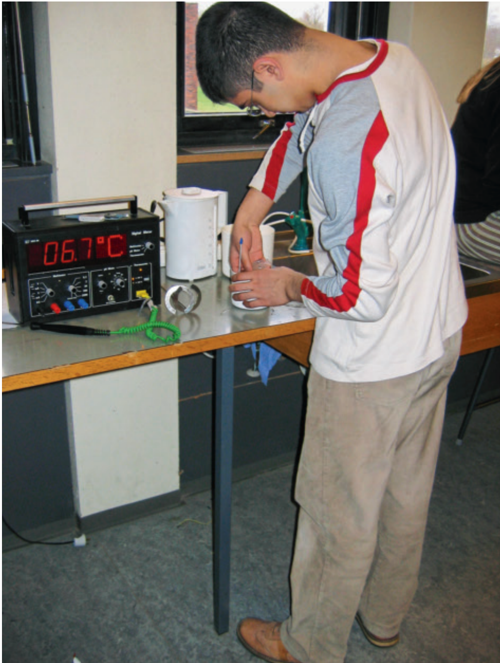
Figur 2. En afkølet væske opvarmes til stuetemperatur. Data fra fysikeksperimentet anvendes efterfølgende til at introducere funktionsklassen y = b(1 - a)^x .