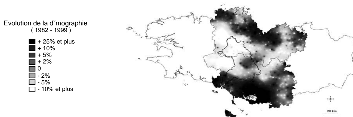
Figure 2. La formalisation d'évolutions passées à long terme et à grande échelle permet l'extrapolation de tendances futures : l'exemple de la démographie.

Le mode de construction du scénario tendanciel est donc essentiellement l'extrapolation des mécanismes de régulation du territoire en place actuellement. Par exemple, on maintient l'hypothèse que l'usage des sols sera en grande partie déterminé par l'évolution de l'agriculture sur des critères de performance économique et que les actions réglementaires s'inscrivent dans ce cadre. Dans cette optique, les perspectives macro-économiques des grandes filières (lait, volailles, porcs, cultures) sont comparées et des hypothèses à long terme sont proposées (recul des volailles, concentration des exploitations laitières et porcines...). De même, les tendances démographiques et socioprofessionnelles sont prolongées en conservant les mêmes critères d'attractivité du territoire. Des cartes d'évolutions régionales resituant le Blavet dans un cadre plus large sont alors particulièrement mobilisées. La figure 2 illustre cette approche pour la démographie.