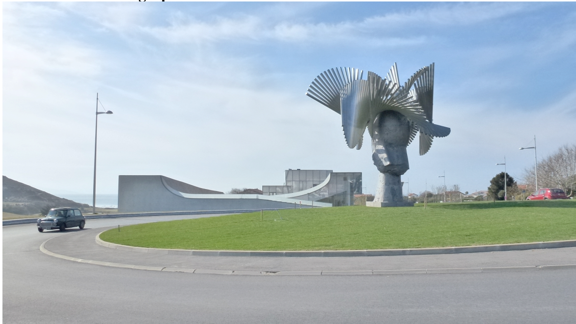
Photographie 1 : La Cité de l'Océan et du Surf à Biarritz

La marchandisation du surf précipite l'émergence de nouveaux espaces de loisirs sportifs qui transforment les stations océanes. De nouveaux modes d'organisation sociospatiale sont lisibles au cœur des stations littorales de la côte aquitaine et témoignent de l'investissement des acteurs locaux. La volonté aménagiste des collectivités territoriales se traduit par la création d'infrastructures consacrées aux sports de glisse. Elles répondent parfois aux demandes formulées par les clubs et les écoles qui commercialisent l'activité. Or, ces équipements marquent le paysage urbain des stations balnéaires. Ces infrastructures témoignent de la volonté des municipalités d'affirmer leur intérêt pour le surf et certains projets, dont celui de la Cité de l'océan et du surf à Biarritz (Photographie 1), permettent de requalifier certains espaces urbains. Ainsi, le surf concourt ainsi à l'émergence d'une organisation spatiale en rupture avec la qualification urbaine et balnéaire classique des espaces des stations au risque d'engendrer comme corollaire une uniformisation des ambiances touristiques sur la côte aquitaine (Vlès, 2011).