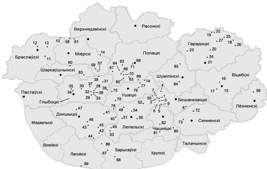
Мал. 2. Карта пахавальных помнікаў Беларускага Падзвіння XIV – XVIII стагоддзяў (нумары на карце адпавядаюць нумарам у спісе пахавальных помнікаў Беларускага Падзвіння XIV – XVIII стст.)

Для лакалізацыі аб'ектаў былі выкарыстаны карты Беларускай ССР 1980-х гадоў выдання маштабу 1:100000 [12]. У асобных выпадках выкарыстоўвалася Польская тактычная карта Вайсковага геаграфічнага інстытута 1919 – 1939 гадоў маштабу 1:100000 [13]. Вынікам стала «Карта пахавальных помнікаў Беларускага Падзвіння XIV – XVIII стагоддзяў» ( мал. 2).