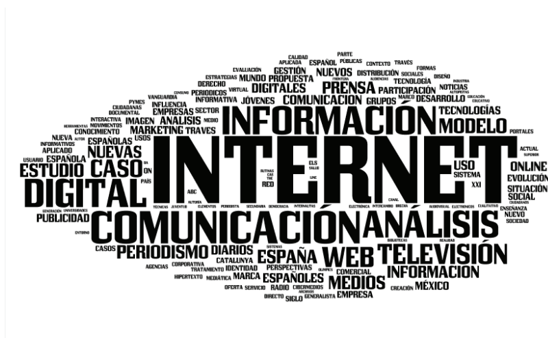
Figura 1. Nube de palabras elaborada con los términos que aparecen en los títulos de las tesis