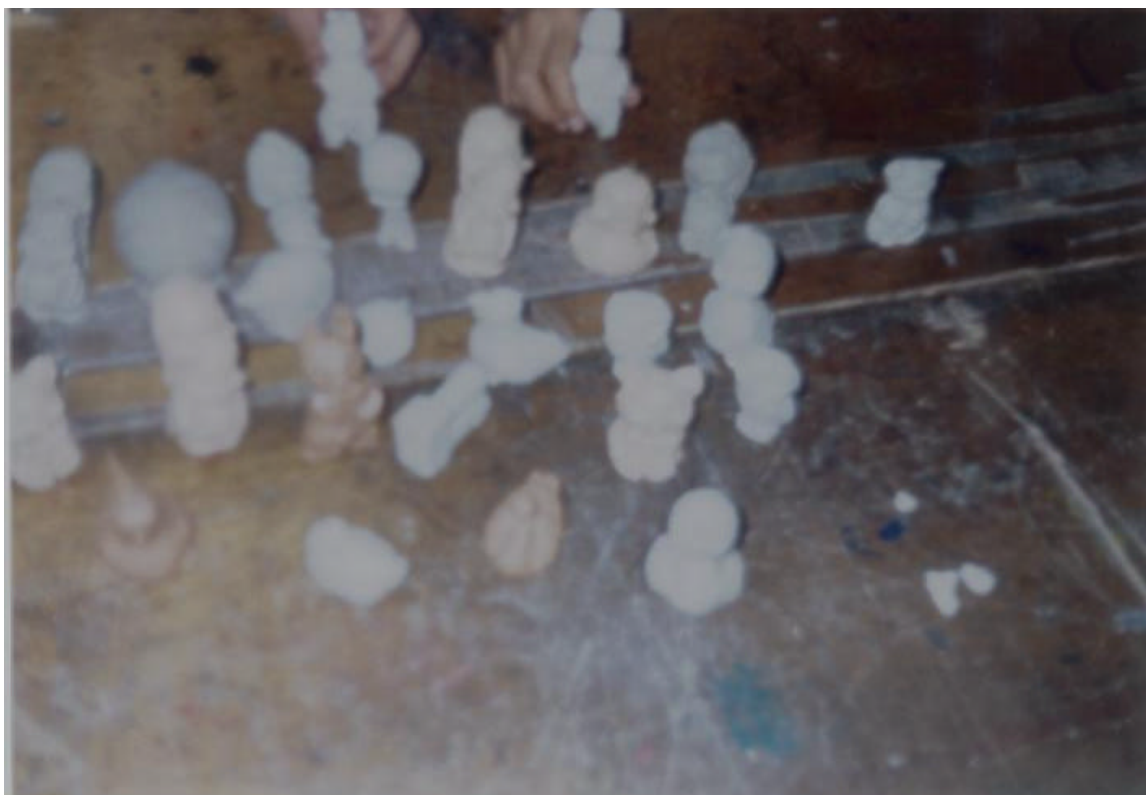
FIGURA 7. LOS ALUMNOS SE SIENTEN SATISFECHOS DE SUS TRABAJOS REALIZADOS EMPLEANDO LA TÉCNICA DEL VACIADO.

SE OBSERVA EL PRODUCTO DEL TRABAJO EFECTUADO A LO LARGO DE LA JORNADA.