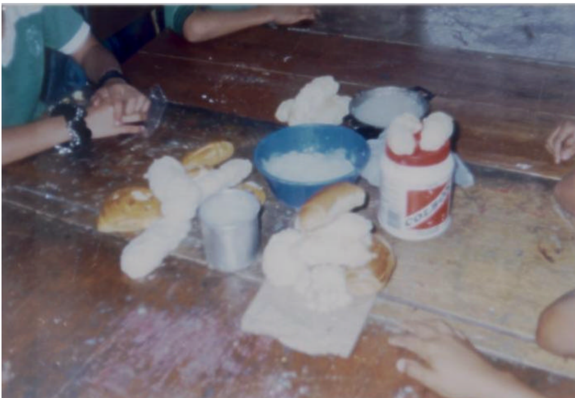
FIGURA 14. LA MIGA DE PAN COMO MATERIAL EN EL MODELADO

SE OBSERVA AL PAN COMO ELEMENTO BÁSICO PARA EL MODELADO