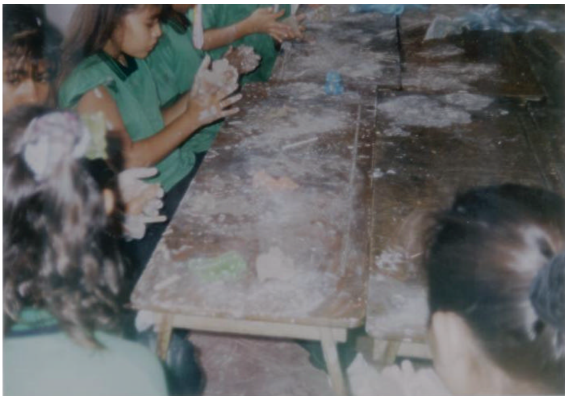
SE OBSERVA A LOS ALUMNOS TRABAJANDO ACTIVAMENTE EN SU TRABAJO CON LA TÉCNICA DEL VACIADO.