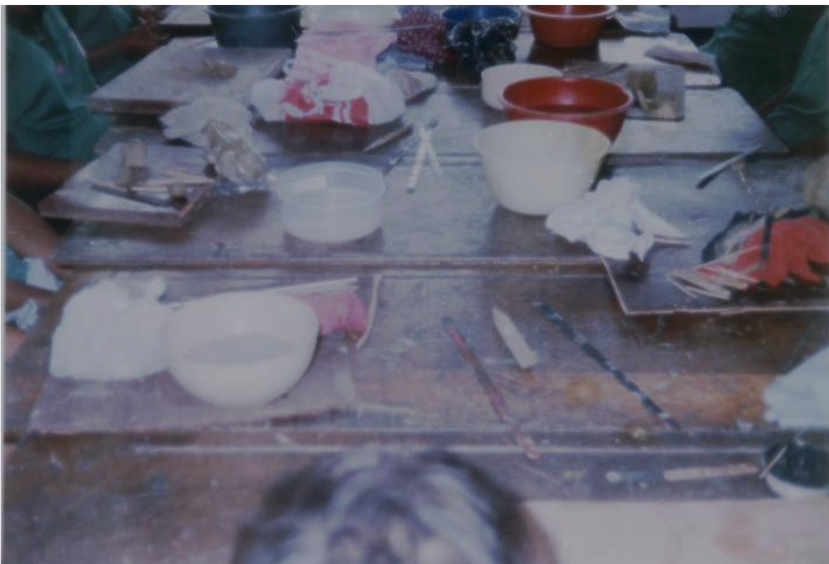
FIGURA 2. LOS ALUMNOS PREPARAN LA ARCILLA

SE OBSERVAN LOS MATERIALES INDISPENSABLES PARA LA TÉCNICA DEL MODELADO .