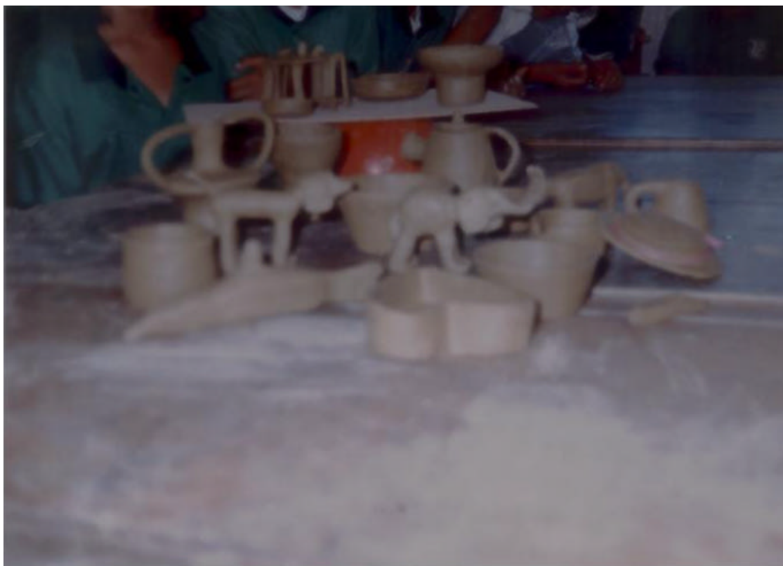
FIGURA 4. LOS ALUMNOS PRESENTAN A LA DOCENTE LOS TRABAJOS ELABORADOS EN CERÁMICA.

SE OBSERVA LA EXPRESIÓN ARTÍSTICA DEL ALUMNO, EN EL MODELADO EMPLEANDO LA CERÁMICA.