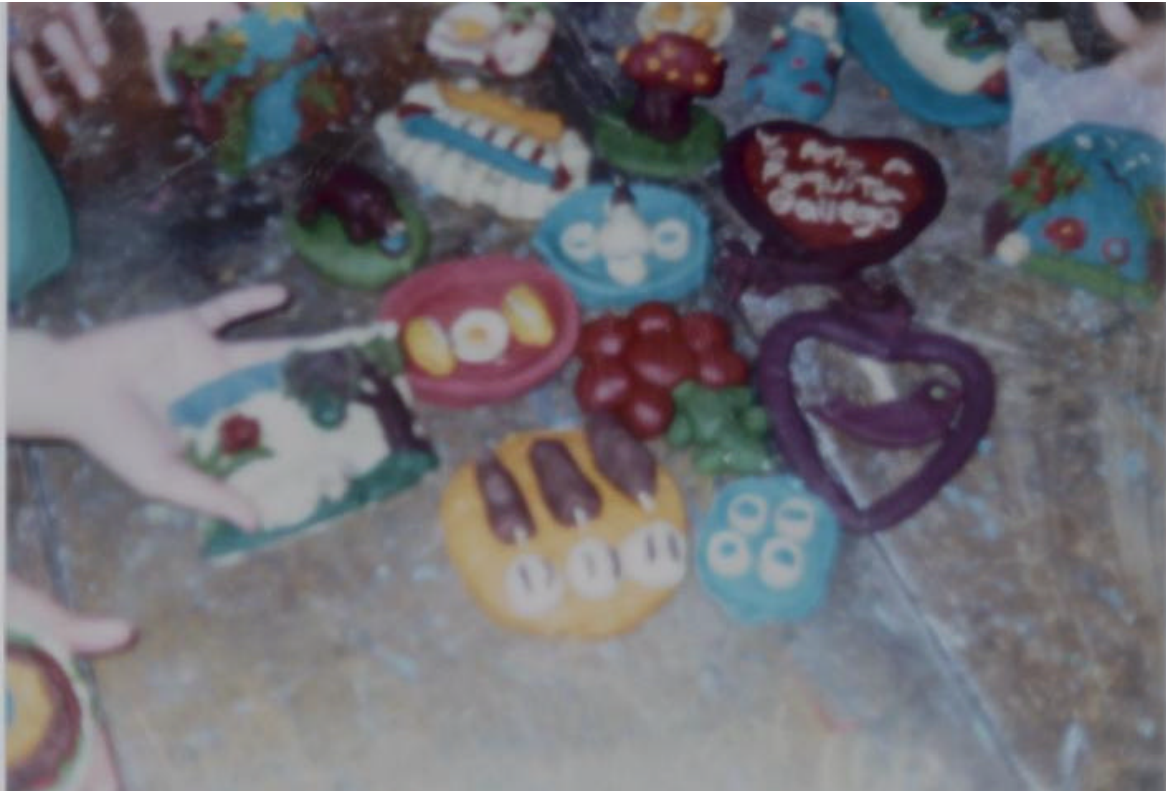
FIGURA 19. FIGURAS REALIZADAS POR LOS ALUMNOS CON PASTA DE MAÍZ.

LA ORIGINALIDAD Y EL COLORIDO ES EL PRODUCTO DE EMPLEAR DIFERENTES TÉCNICAS Y ELEMENTOS EN EL MODELADO.