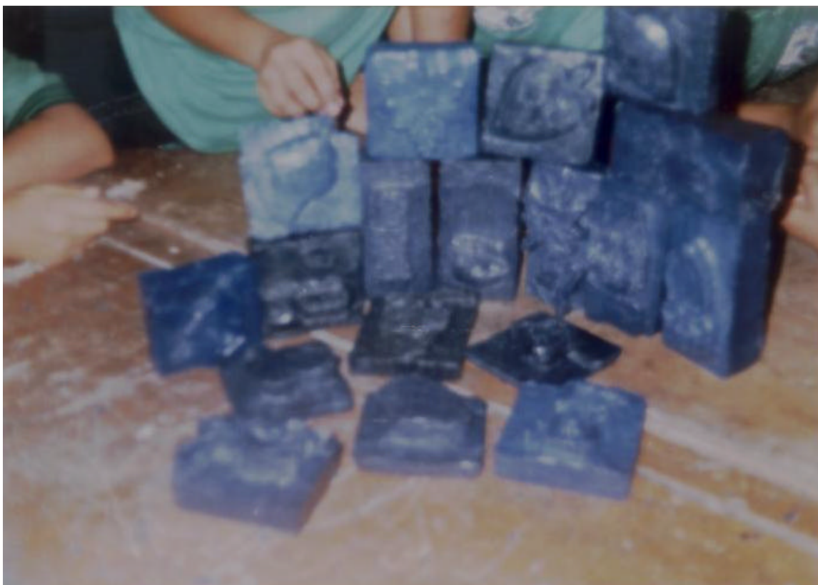
SE OBSERVA LA CREATIVIDAD DEL ESTUDIANTE, EN EL MODELADO CON JABÓN.