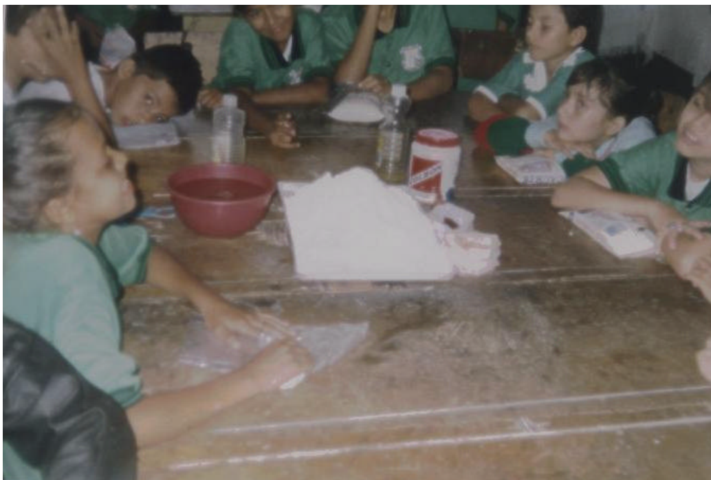
FIGURA 20. LA PASTA DE SAL COMO MATERIAL PARA EL MODELADO

SE OBSERVA EL ASOMBRO Y A LA VEZ SATISFACCIÓN POR CONOCER OTRO ELEMENTO Y TÉCNICA EN EL MODELADO.