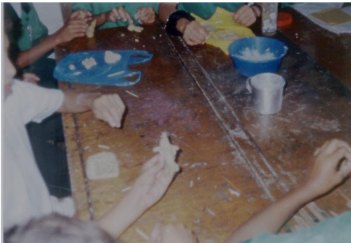
FIGURA 21. ELABORACIÓN DE DIFERENTES FIGURAS MEDIANTE LA PASTA DE SAL.

LOS ALUMNOS REALIZAN DIFERENTES FIGURAS EMPLEANDO LA PASTA DE SAL COMO MATERIAL EN SU MODELADO.