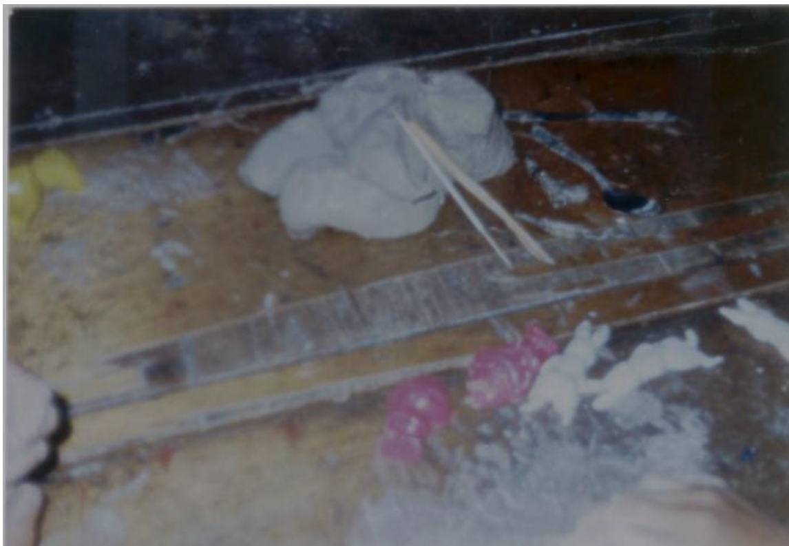
FIGURA 5. LOS ALUMNOS EMPLEAN LOS DIFERENTES MATERIALES EN LA TÉCNICA DEL VACIADO.

SE OBSERVA A LOS ALUMNOS, CONOCIENDO LOS DIFERENTES ELEMENTOS PARA ELABORAR SUS TRABAJOS