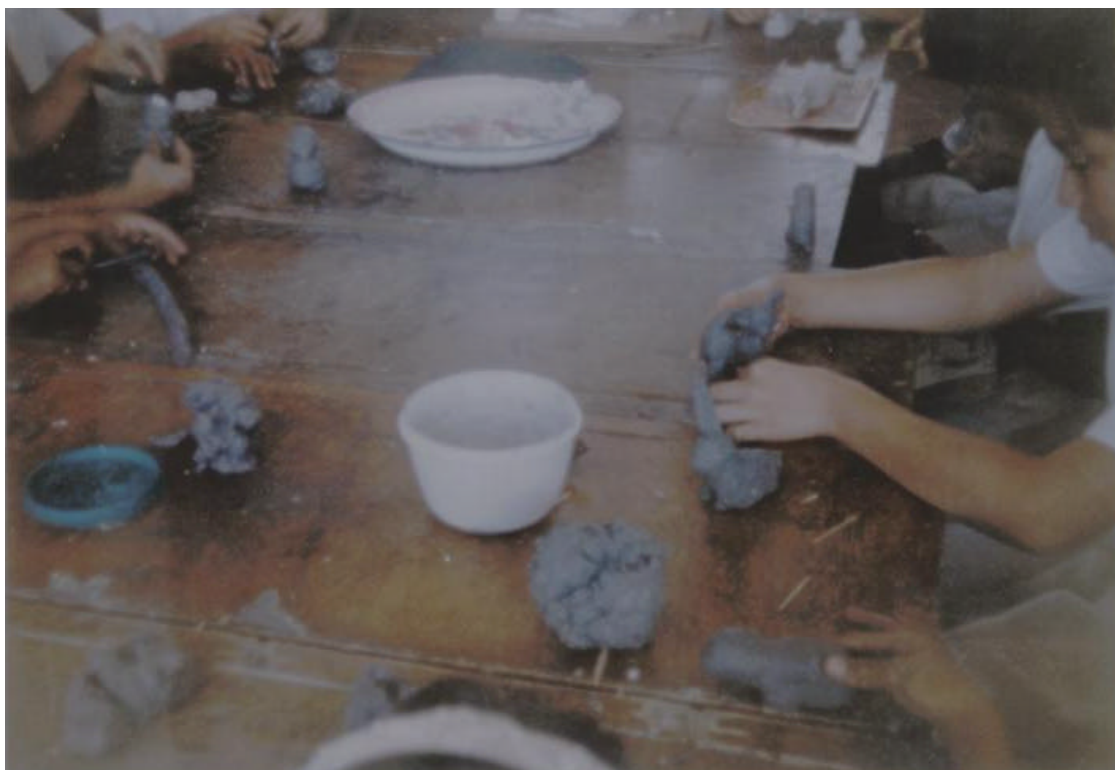
LOS ALUMNOS EMPLEAN TÉCNICAS PARA LA ELABORACIÓN DE MODELADO EN PAPEL MACHE.