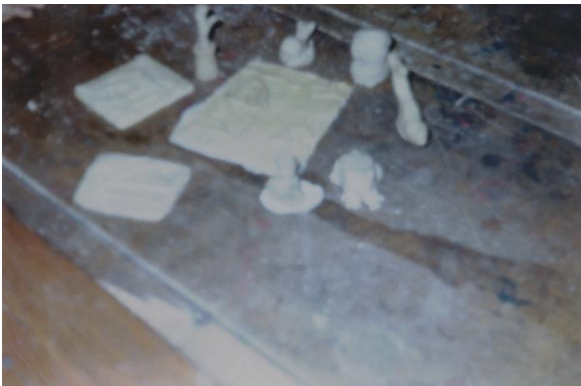
FIGURA 16. LOS ALUMNOS PRESENTAN LAS DIFERENTES FIGURAS OBTENIDAS CON EL MODELADO CON MIGA DE PAN.

COMO PUEDE OBSERVARSE LOS ALUMNOS SON ORIGINALES EN SUS EXPRESIONES MEDIANTE EL USO DE LA MIGA DE PAN.