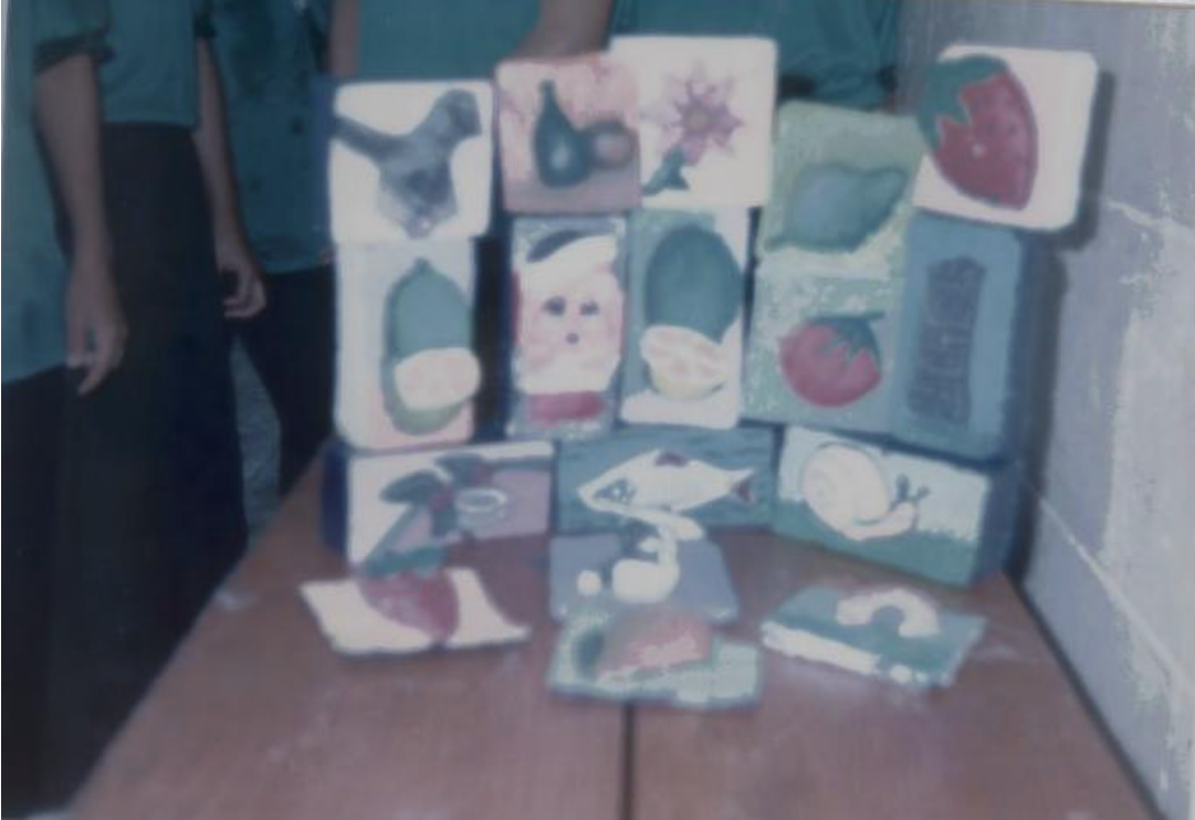
FIGURA 13. DIFERENTES MODELADOS CON JABÓN.

LOS ALUMNOS HAN TERMINADO SU TRABAJO DE MODELADO EN JABÓN, CON CREATIVIDAD, ORIGINALIDAD Y COLORIDO.