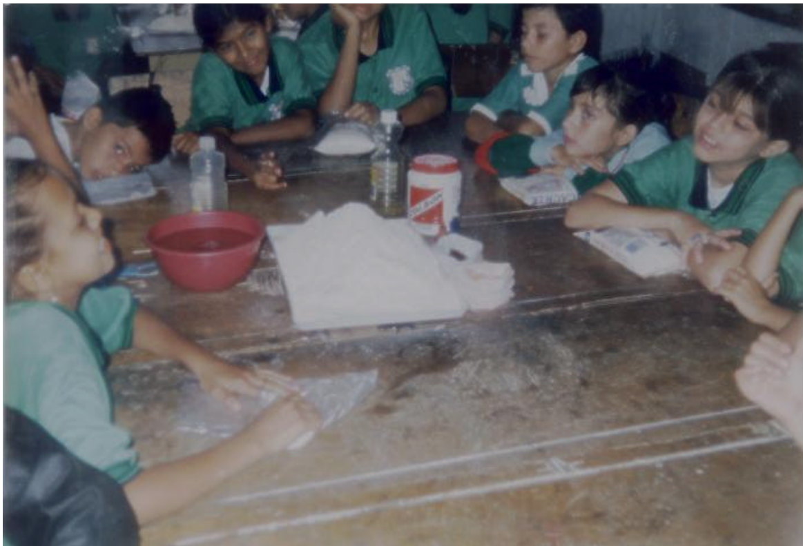
FIGURA 17. LA PASTA DE MAIZ COMO MATERIAL PARA EL MODELADO

LOS ALUMNOS OBSERVAN LA HARINA DE MAÍZ Y DEMÁS ELEMENTOS QUE EMPLEARÁN EN EL MODELADO.