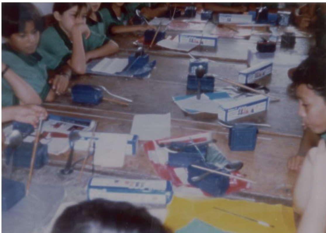
FIGURA 11. MODELADO EN JABON

LOS ALUMNOS CONOCEN LA TÉCNICA DEL MODELADO EN JABÓN, MANIPULANDO LOS DIFERENTES MATERIALES.