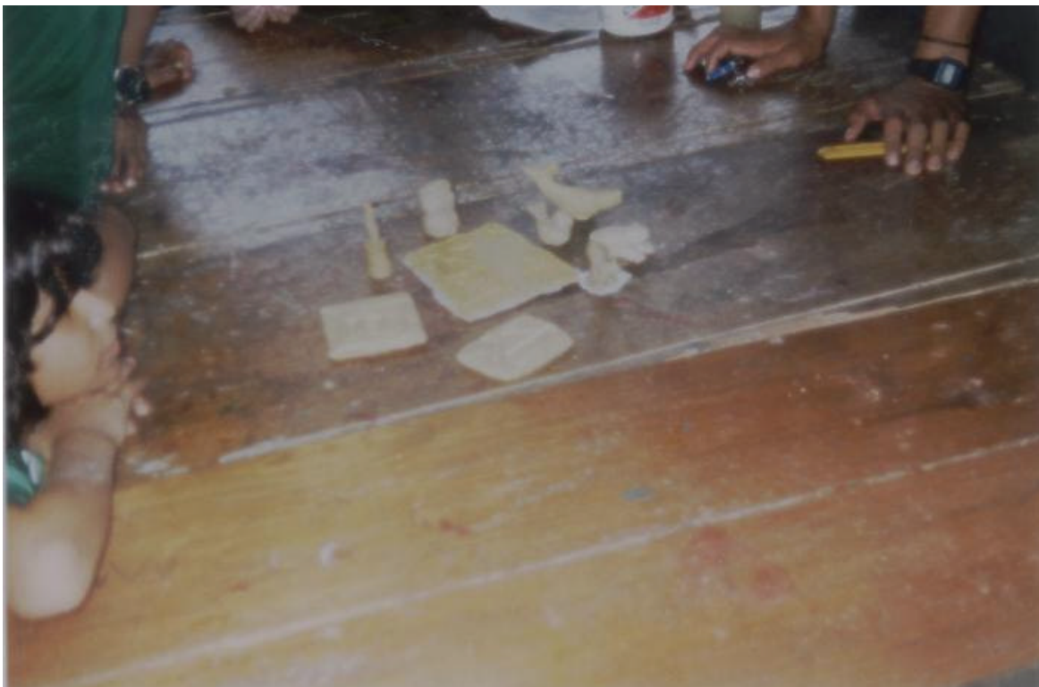
FIGURA 22. FIGURAS REALIZADAS POR LOS ALUMNOS EN PASTA DE SAL

SE OBSERVA LA CREATIVIDAD Y ORIGINALIDAD DE LOS ALUMNOS EN EL MODELADO CON PASTA DE SAL.