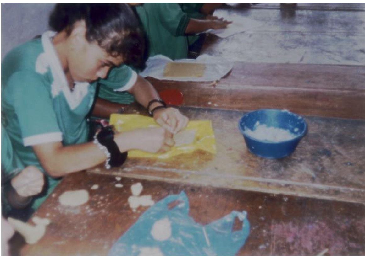
FIGURA 15. LOS ALUMNOS EMPLEAN LA PASTA DE PAN EN EL MODELADO.

UNA VEZ APRENDIDA LA TÉCNICA DEL MODELADO, EMPLEANDO LA PASTA DEL PAN, LOS ALUMNOS SON CREATIVOS EN SUS DIFERENTES EXPRESIONES.