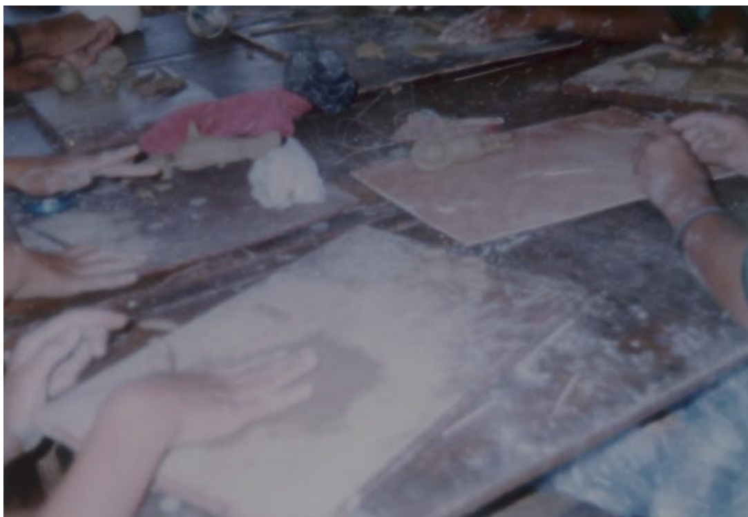
FIGURA 3. LOS ALUMNOS EMPLEAN LAS DIFERENTES TÉCNICAS Y MATERIALES PARA MODELAR LA ARCILLA.

LOS ALUMNOS CON MANOS Y DEDOS MODELAN LA CERÁMICA, REALIZANDO DIFERENTES FIGURAS.