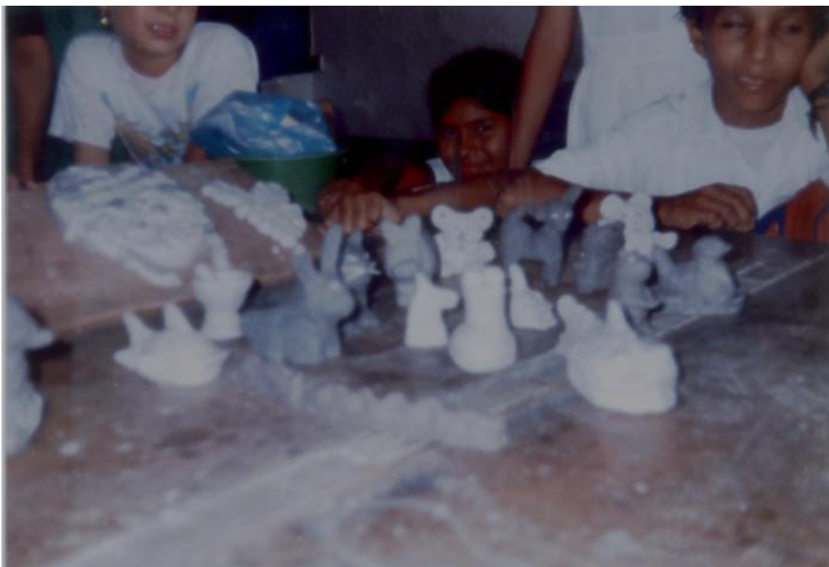
FIGURA 10. FIGURAS ELABORADAS POR ESTUDIANTES EN PAPEL MACHE.

LOS ALUMNOS PRESENTAN LAS DIFERENTES FIGURAS EN PAPEL MACHE.