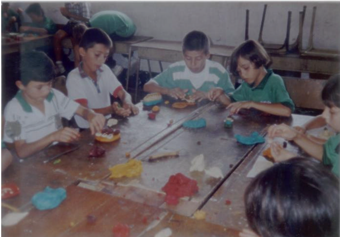
FIGURA 18. LOS ALUMNOS EMPLEAN LA PASTA DE MAÍZ EN EL MODELADO DE FIGURAS.

SE OBSERVA LA CREATIVIDAD DE LOS ESTUDIANTES EN EL MODELADO CON LA PASTA DE MAÍZ.