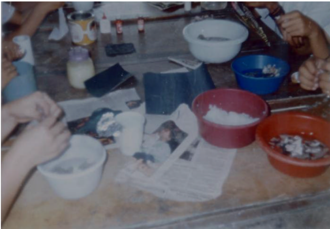
FIGURA 8. MODELADO EN PAPEL MACHE

LOS ALUMNOS CONOCEN LOS ELEMENTOS Y MATERIALES NECESARIOS PARA EL MODELADO EN PAPEL MACHE.