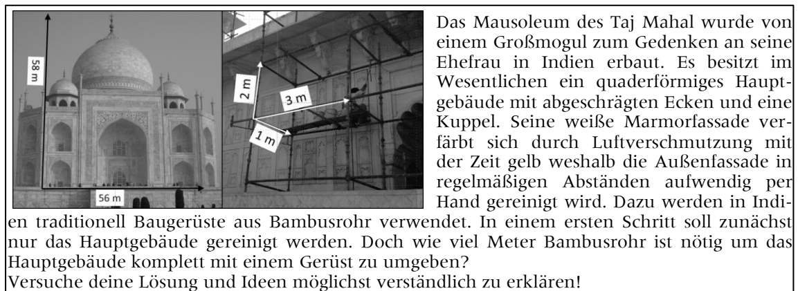
Fig. 1: Aufgabe „Zahnpasta“, Aufgabe „Stadion“, Aufgabe „Taj Mahal“

Im Stadtgebiet soll ein neues Stadion (ein reines Fußballstadion) gebaut werden, was ca. 75.000 sitzende Zuschauer aufnehmen kann. Bei der Planung muss eine Sitzfläche mit einer Breite und Länge von 60cm berücksichtigt werden. In einem weiteren Schritt muss jetzt geklärt werden, wie groß das Stadion sein muss um die geforderte Zuschauerkapazität aufnehmen zu können, unter der Berücksichtigung, dass das Spielfeld eine Länge von 105m und eine Breite von 68m hat. Wie sieht dein Stadion aus und welche Außenmaße muss das Stadion haben?