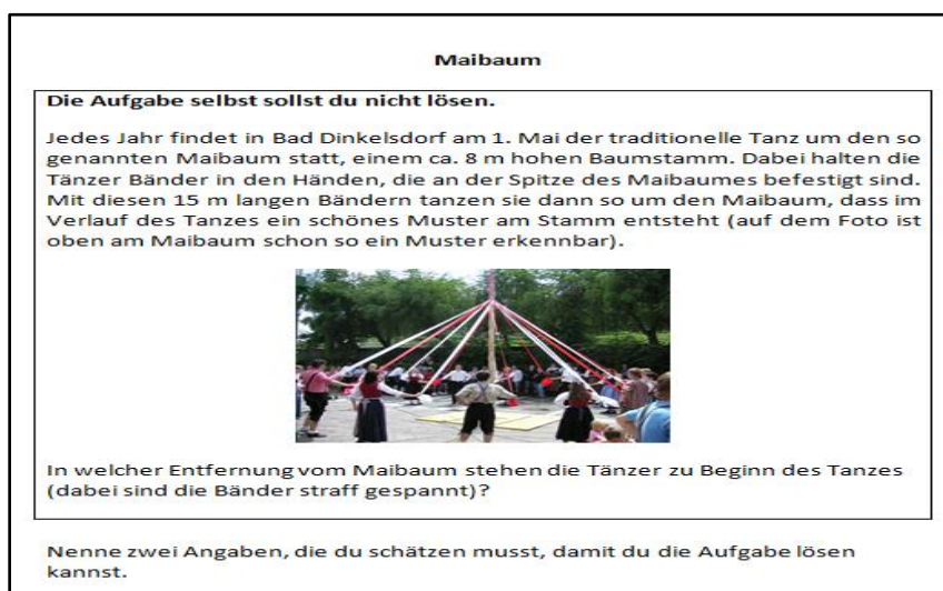
Abbildung 1: Beispielitem zur Teilkompetenz Treffen von Annahmen

Es wurden 107 Realschüler (50,5% weiblich, im Durchschnitt 15,71 Jahre alt) aus drei Schulen untersucht. Die Testeinheit dauerte 80 Minuten. Im Leistungstest wurden Modellieren als Ganzes, mathematisches Arbeiten, Auswahl relevanter Information und das Treffen von Annahmen erhoben. Bei der vorliegenden Operationalisierung umfasst die Teilkompetenz Treffen von Annahmen z.T. auch die Identifikation wichtiger Informationen. Die verwendeten Items wurden zum Teil aus der DISUM-Studie übernommen und zum Teil neu entwickelt. Ein Beispielitem für das Konstrukt Treffen von Annahmen ist: